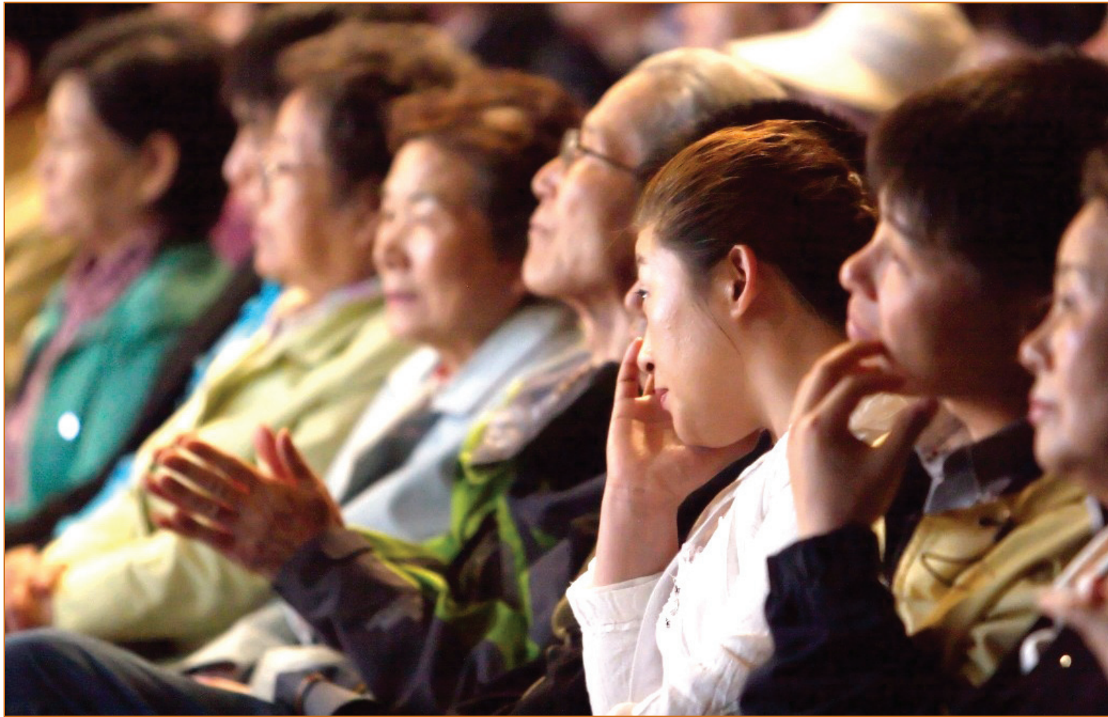
圖：神韻正統的旋律和節奏已經喚醒韓國人沉睡已久的心靈與情感。

曾三次當選韓國國會議員、諾貝爾獎候選人、現任聯合國和平大使的金浩一，偕同韓國舞蹈專家的夫人李京烈前來觀看演出，他們表示對每個節目都很喜歡，「就像期待的一樣，我看到中國藝術的真諦。」身為韓國舞保存研究會會長的李京烈表示，「今天演出的舞蹈和韓國的舞蹈感覺很不一樣，中國舞很有體系，演員經過很長時間的訓練，其中我對《迎春花開》這個舞蹈及手絹印象最深。」