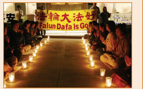
世界各地法輪功學員紀念「四·二五」 (P7)