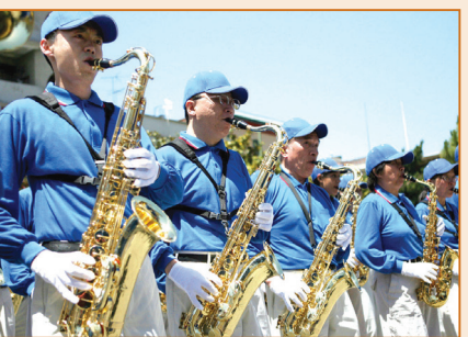
矽谷工程師談走上修煉之路的前後（第三頁）