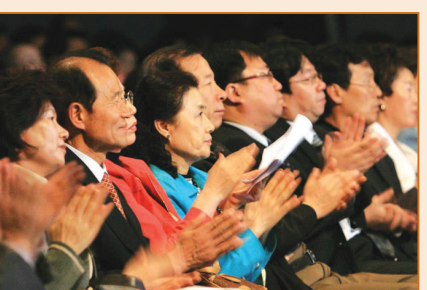
神韻從新延續斷脈的真正中國文化（第八頁）