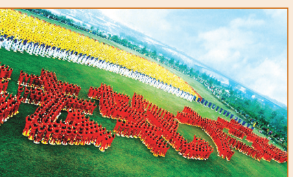
歷史轉轉如大戲 千載機緣莫錯失（第四頁）