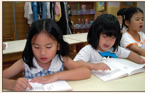
在「真善忍」中茁壯成長的兒童(第三頁)