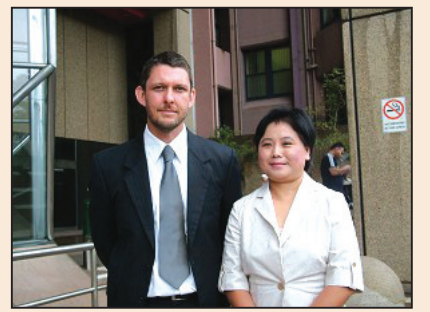
訴江案 澳各界政要紛紛表支持(第七頁)