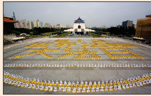
全世界法輪功學員同慶「世界法輪大法日」(第七頁)