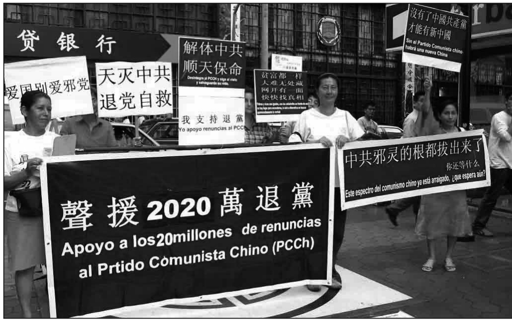
圖：秘魯首都利馬唐人街一幕

位於利馬華人社區中心的甲邦街是利馬的旅遊景點，也是中共妄圖操控的地段。二零零一年法輪功學員在甲邦街發放傳單時，曾被保安驅趕。由於法輪功學員堅持在此講真相，中共使館派人到親共的處理僑務的通惠總局開對付法輪功的會議，聲稱誰對法輪功學員支持和同情的就打壓誰，使當地的華人對法輪功的活動產生害怕心理。