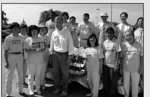
圖：國會議員Akin先生和法輪功學員合影留念

活動結束時，藝術節的主辦者說，法輪功代表中國傳統文化參加這次藝術節讓他們感到很榮幸，這使藝術節辦的更好。