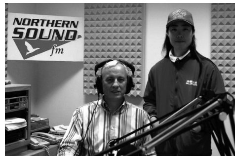
圖：愛爾蘭北部之聲電台採訪法輪功學員

很多中國的留學生也進一步的了解了迫害真相，對於中共迫害老百姓的暴力行徑表示非常的憤慨，幾位中國人當場表示退出中共的一切組織。有兩位中國