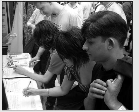
圖：格拉斯哥人紛紛簽名譴責中共對法輪功的迫害

之後，他幾次帶著老鄉看圖片和要資料。許多中國人接到真相資料後，用感激和讚許的眼神看著法輪功學員，有的人前來與法輪功學員握手致謝，希望法輪功學員千萬要堅持到底。