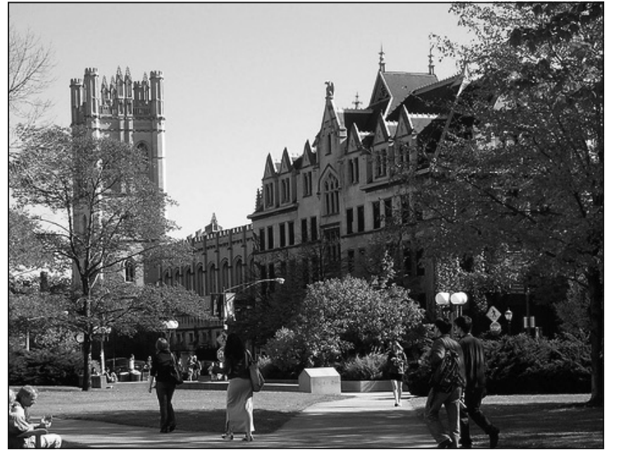
圖為芝加哥大學校園

我幾乎沒有付出就得到了許多。我的父母在中國生活貧困，來美時什麼都沒有，只有身上的衣服，人生