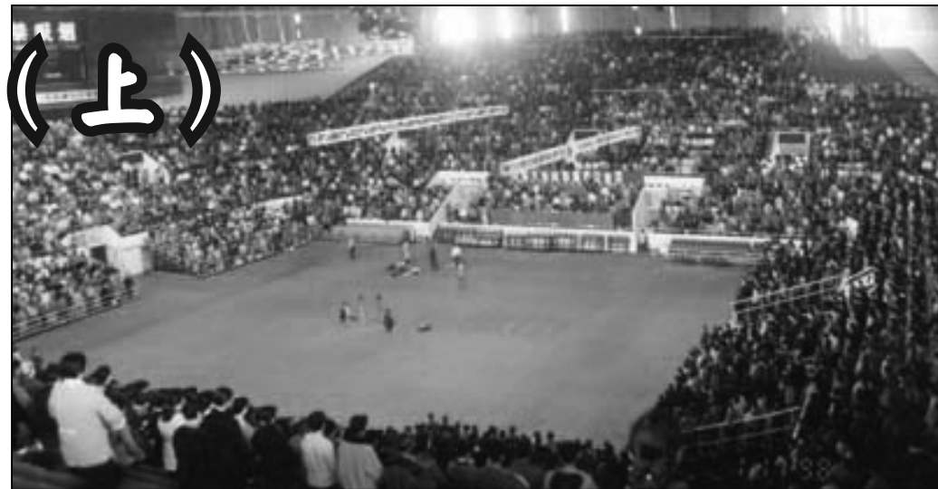
圖：1998年在廣州天河體育館召開的心得交流會。

連單位評職稱、申請項目經費等，我也按修煉人的標準，勸告我的員工和學生們，儘量把平