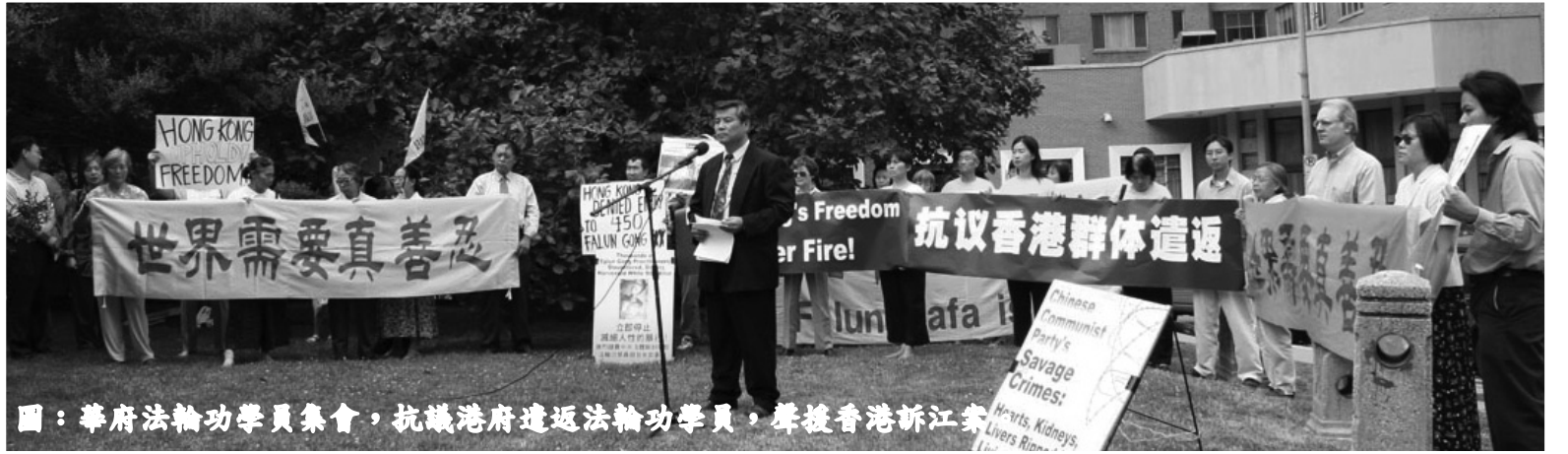
圖：華府法輪功學員集會，抗議港府遣返法輪功學員，聲援香港新江案

的確，看看這幾年中共在香港回歸後的作為，一直在限制人們的自由，以便把大陸的政治運動能夠直接輸出到香港。但是，出乎中共意料的是，香港民眾畢竟體驗過自由社會，對大陸的獨裁統治有相當的認識，這些年一直在頑強抗爭。香港法輪功學員為了維護信仰自由，這些年也一直在向國際社會發出呼籲，動員國際社會的力量制止中共在香港的人權打壓行徑，包括中共為了給在香港迫害法輪功鋪平道路