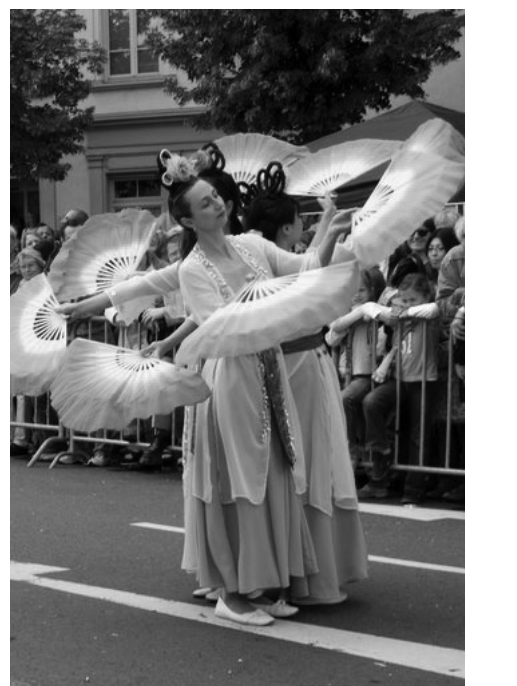
圖：法輪功學員遊行過程中的表演

遊行隊伍開始啓程時，暴風雨來臨了。參加遊行的人頃刻間從外到裡全身濕透，有約二十個團體退出了遊行。而法輪功學員組成的天國樂團、舞蹈隊、腰鼓隊和展示功法的學員卻在暴雨中毫不動搖，泰然自若的繼續表演。一個警察在看到天國樂團時情不自禁的脫口而出：「真是太棒了！」一位生活在法蘭克福的西班牙人說：「開始時我還以為是個德國軍樂隊呢。」優美的「法輪大法好」音樂和曼妙的扇子舞及蓮花舞也讓觀