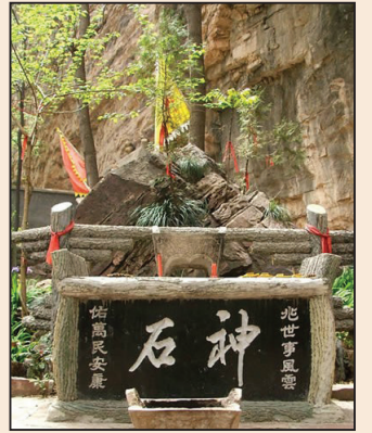
奇石與天象人間(第八版)