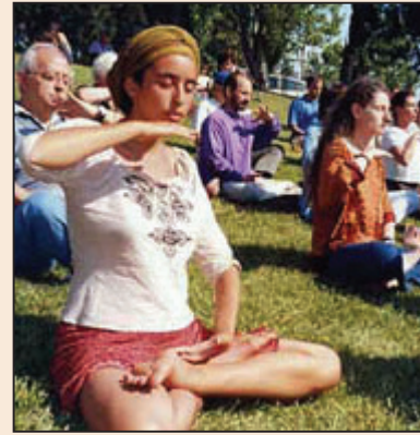
西班牙健康博覽會(第七版)