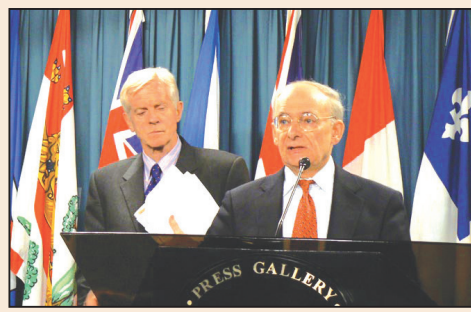
「這個地球上前所未有的邪惡」(第六版)