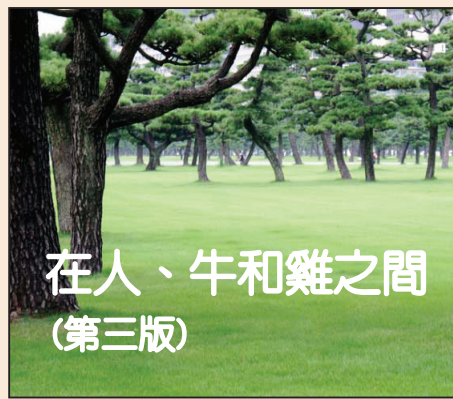
在人、牛和雞之間 (第三版)