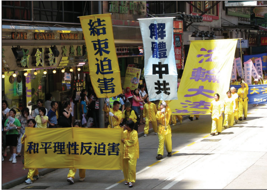
圖：香港法輪功學員浩浩蕩蕩遊行往西區中聯辦，宣讀聲明。

七月十四日，數百名香港法輪功學員在維多利亞公園舉行集會，抗議中共惡首江澤民對法輪功學員的殘酷迫害。香港支聯會主席司徒華、前立法會議員馮智活牧師等獲邀出席發言。身為法輪功受迫害真相聯合調查團亞洲分團副團長的司徒華指出，中共