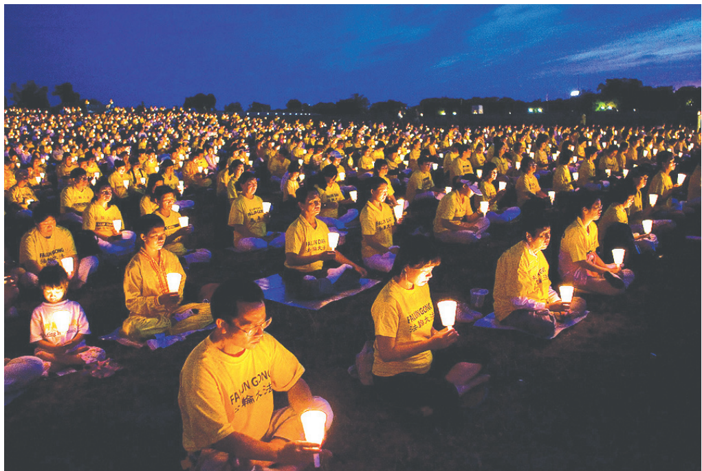
圖：2007年7月20日，來自世界各地的大法弟子手捧點燃的蠟燭，在美國首都的華盛頓紀念碑廣場悼念為維護「真、善、忍」真理而遭中共迫害致死的法輪功學員，呼籲立即結束長達八年的殘酷迫害。

但是從中外預言來看，中共的滅亡不止是一個政黨的問題，這件事與我們每一個中國人都息息相關。《聖經啟示錄》的預言中非常明確指出加入其中，舉起右拳向其宣誓的人都有性命之憂。劉伯溫碑記預言提到「貧者一萬留一千，富者一萬留二三；…十愁難過豬鼠年」。所以現在海內外都流傳著「天滅中共、三退保命」這句話。大紀元發表的《九評共產黨》讓人們都看清它的邪惡本質，引發了至今超過二千三百萬人退出中共的黨團隊組織。面對關乎自己性命的問題，怎能漠然視之呢？無論從古代預言的真實性、還是從中國現實來分析，選擇退出中共都是為自己生命負責的明智之舉呀！