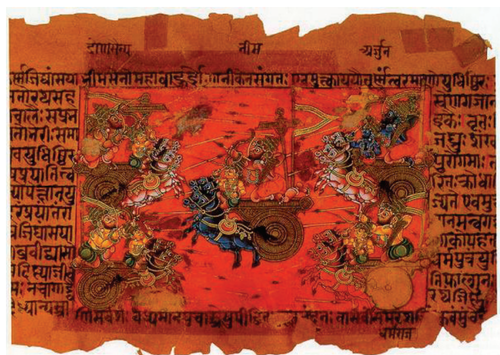
史詩手卷中描繪俱盧之野戰爭的插圖

考古學家發現，古印度典籍中在計算時間上使用了兩種與遠古時代非常不適用的數學概念：「卡而帕」和「卡希達」，即42億3200萬年和1億分之3秒兩個概念，人們不禁要問：身著樹皮的古代居民用的上嗎？而核物理學家對此的回答則更讓人驚奇了：在自然界需要用億年和億分之秒來量度的只有放射性同位素的衰變率。如，鈾-238的半衰期為45億1000萬年，而k介子的壽命