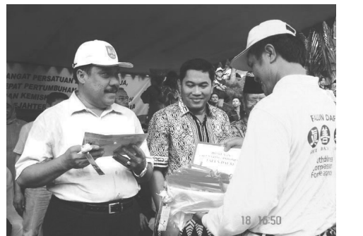
圖：市長（左）接受法輪功真相資料

遊行過程中，街道兩邊擠滿了圍觀的民眾。懸掛著各種不同圖案洪法書籤的紙蓮花深受民眾