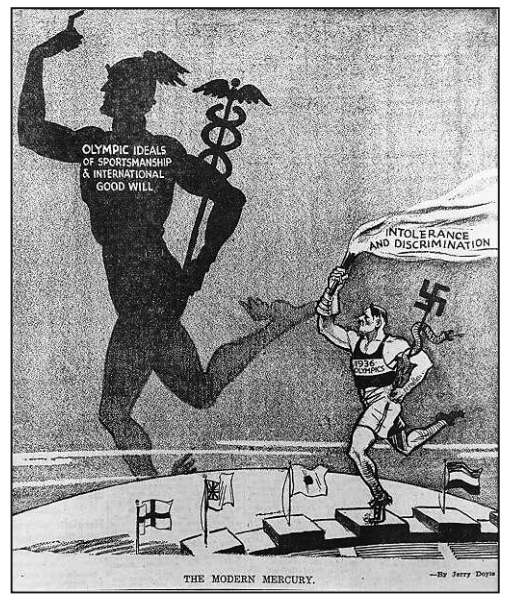
圖：1935年12月7日的《費城紀事報》登載的漫畫，諷刺1936年的柏林奧運。高大的古希臘運動員身上寫著「奧林匹克的體育理想和國際社會的美好願望」，納粹運動員的火炬上寫著「歧視與不容忍」

相反，傳播「九評」、促「三退」（退出中共黨、團、隊），為停止中共的罪行而努力的人才會真正贏得世界的尊重，才真正向世界展示了站直了腰的炎黃子孫的精神風範。