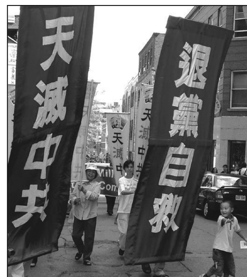
圖：蒙特利爾民眾聲援兩千五百萬人退出中共惡黨

八月二十四日上午，澳洲昆士蘭全球退黨服務中心在布里斯本中國城舉行勇氣長城活動，聲