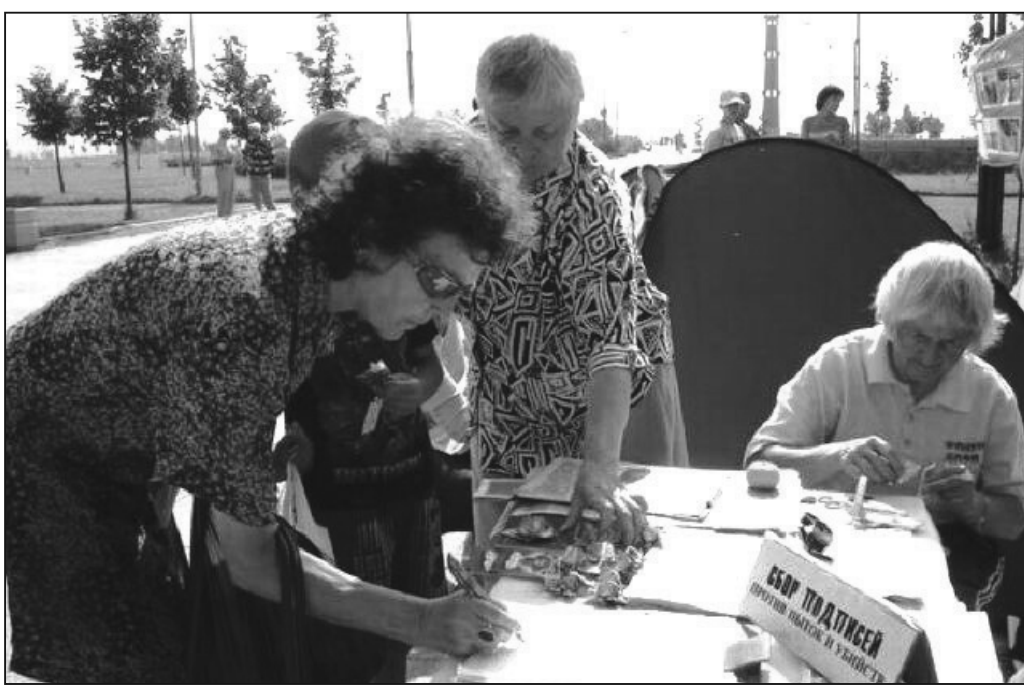
圖：人們明白真相後都紛紛簽名支持法輪功反迫害

沒看到過真正的善良，他不相信這個世界上有真正的善良。當他讀完了法輪功真相報紙後來到學員們身邊，十分感慨的說：