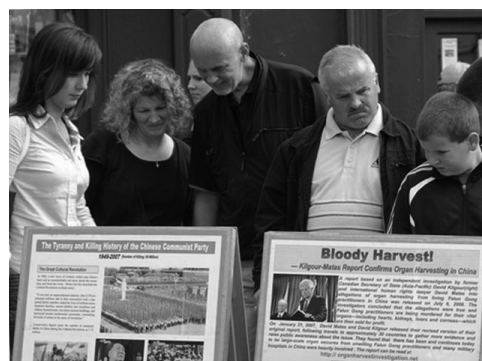
圖：民眾簽名反對中共對法輪功的迫害