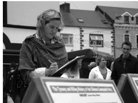
圖：人們了解到法輪功被迫害的真相