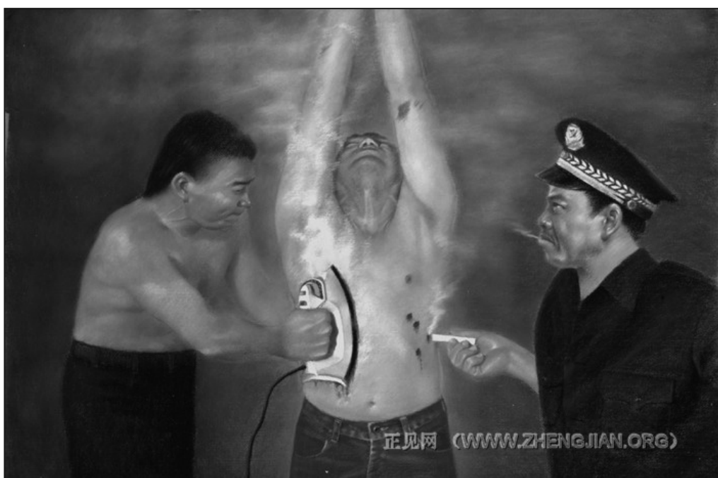
承受苦難的大法弟子