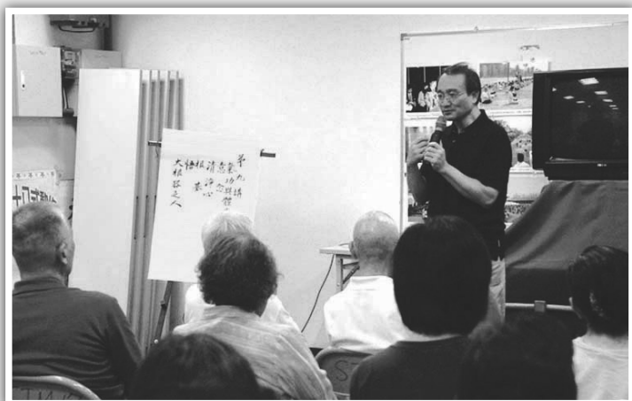
圖：一位當教授的學員講了自己的修煉心得