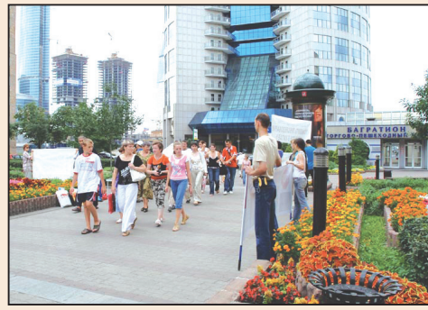
俄羅斯法輪功學員莫斯科街頭講真相(第七版)