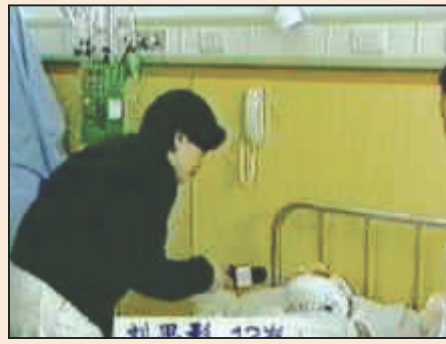
從CCTV「終結」網友性命想到的(第三版)