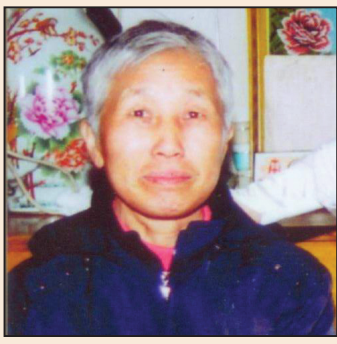
錦州市太和公安分局惡警綁架行兇(第二版)