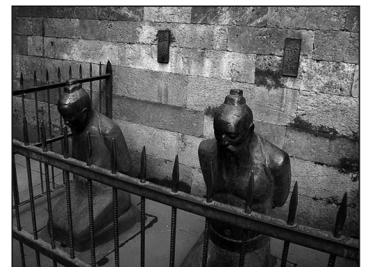
圖：杭州岳墳前秦檜夫婦跪像