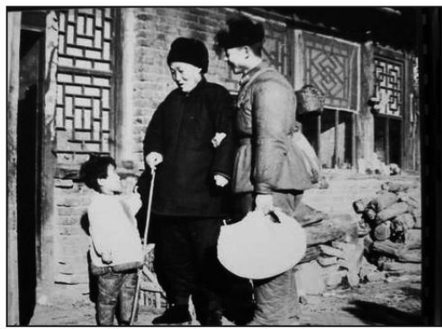
圖：點評：扶老攜幼，還有隨身攝影師跟隨抓拍這麼精彩的瞬間，真是「好人」有「好事」啊。

有4名外國記者，專門到撫順雷鋒紀念館採訪，他們指著雷鋒給傷病員送蘋果，雨夜送大娘的照片說：雷鋒做好事是自發的還是被迫的，為什麼雷鋒做好事還有照片，這是不是經過「導演」的？一個普通戰士，短短的一生竟然留下了大約384張照片，很多是被抓拍到的做好人好事的照片。在當時照相還是奢侈品的年代，怎麼可能呢？