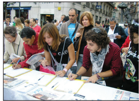
上圖：馬德里當地民眾和遊客們排隊等候簽名支持反迫害和退中共。

香港支聯會主席司徒華發言表示，退黨是人民覺醒的第一步，接著應該以積極態度跟進，進行反思並將反思的內容記下，成為家族歷史，讓後人知道。