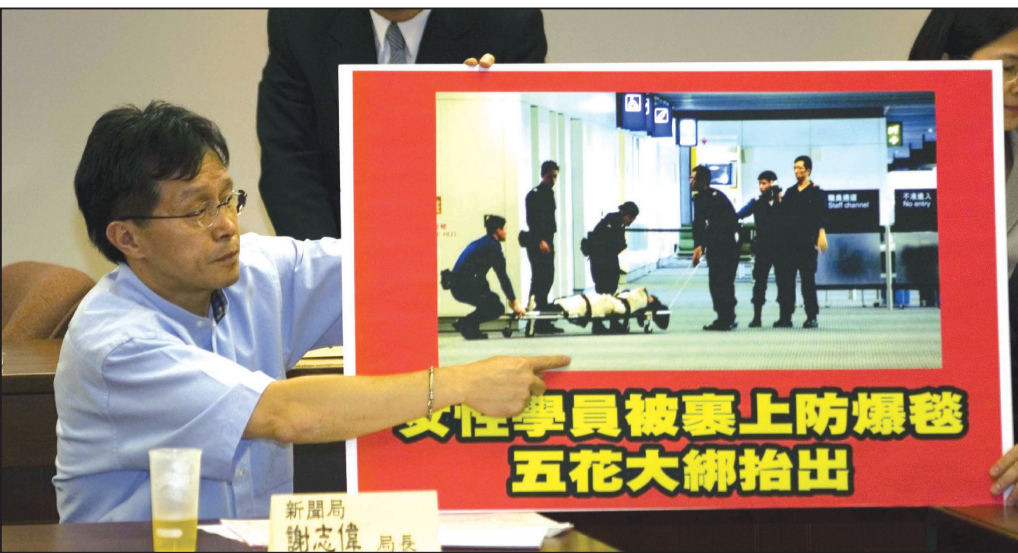
圖：台灣新聞局長和行政院發言人謝志偉譴責港府屈從中共對法輪功學員的不人道行為。

立法院罕見的一百一十七名立委，跨黨派聯署提案，創下台灣政黨輪替以來，不分黨派、不分地區具有高度共識的提案。立法院要求政府相關單位，應代表台灣人民嚴正譴責香港特區政府屈從於中共中央之幕後指使，釀成此最大規模暴力群體遣返台灣人民事件，要求港府正式道歉、提出賠償損害並保證此傷害兩地情誼之惡事不再發生。