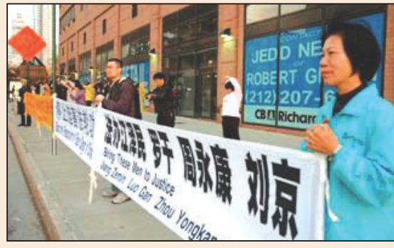
一位退休數學教師的故事(第六版)