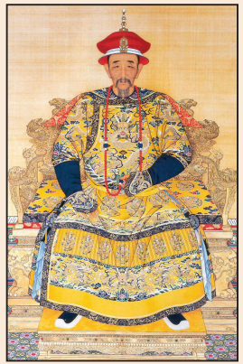
康熙對地震成因的認識(第八版)