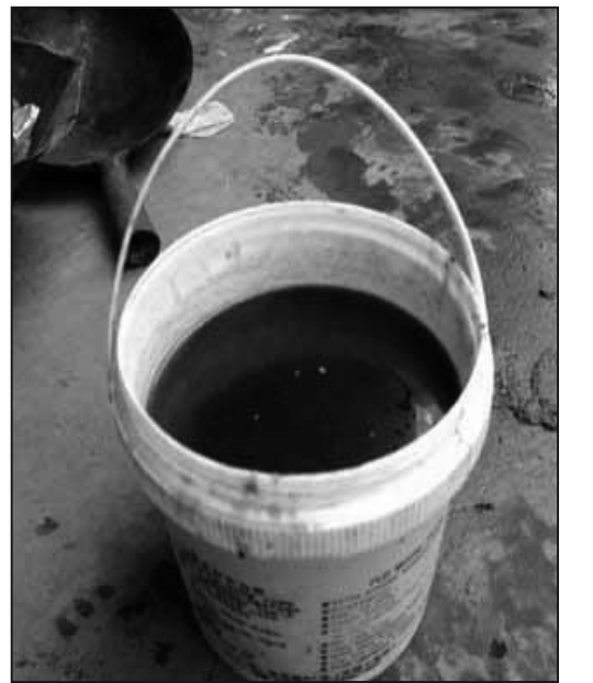
圖：無神論造成的道德崩潰——「民以何食為天」：從陰溝裡提煉食用油，成本極低而賺頭很大。

如果不消除中共和江澤民一夥對法輪功的迫害，不恢復對神的正信，不從精神上除掉中共的毒素，怎麼可能真正剷除生活中的假冒偽劣有毒食品呢？