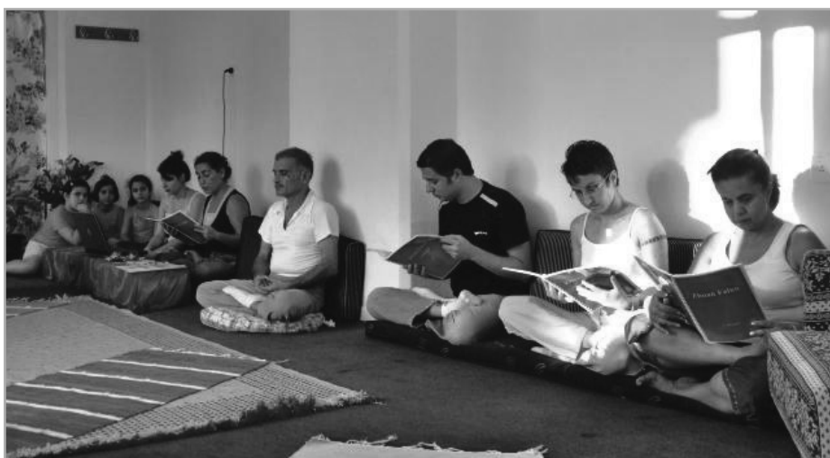
圖：在墨爾迅大家一起學法，交流心得