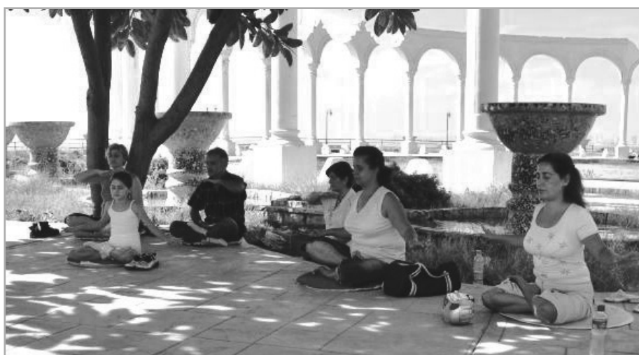
圖：法輪功學員在墨爾迅市海邊煉功