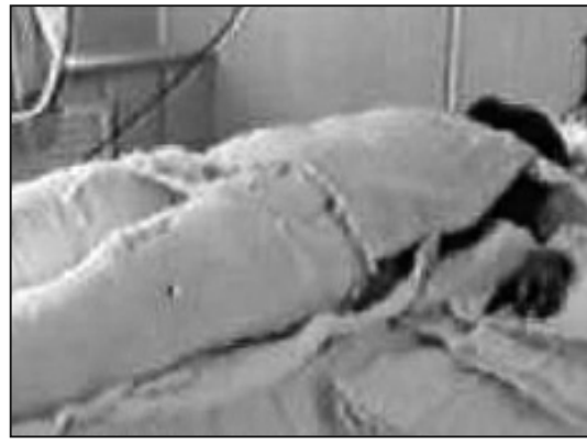
圖：中央電視台「天安門自焚偽案」中的「燒傷病人」全身包裹嚴嚴實實，怕暴露什麼呢？

大原因，就是無神論。對法輪功的迫害，是共和江澤民一夥在新時期為維護「無神論」而作的歇斯底里的最後一搏。「天安門自焚偽案」則是中共為迫害法輪功製造仇恨藉口的集邪惡之大成。「天安門自焚偽案」進入小學課本，是中共企圖從小就給孩子洗腦灌輸無神論的無恥舉動。