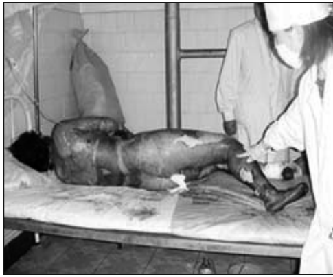
圖：燒傷病人要在空氣中晾著，護理人員要穿衛生服，戴口罩以防感染。

「往油條裡摻入洗衣粉」，「蘇丹紅造出『紅心』鴨蛋」，「從陰溝裡提煉食用油」，「給黃和螃蟹喂避孕藥快速增肥」「非法回收藥品牟取巨額利潤」「用澱粉製作假避孕藥特大案」「破獲假鹽大案500噸」「紙餡包