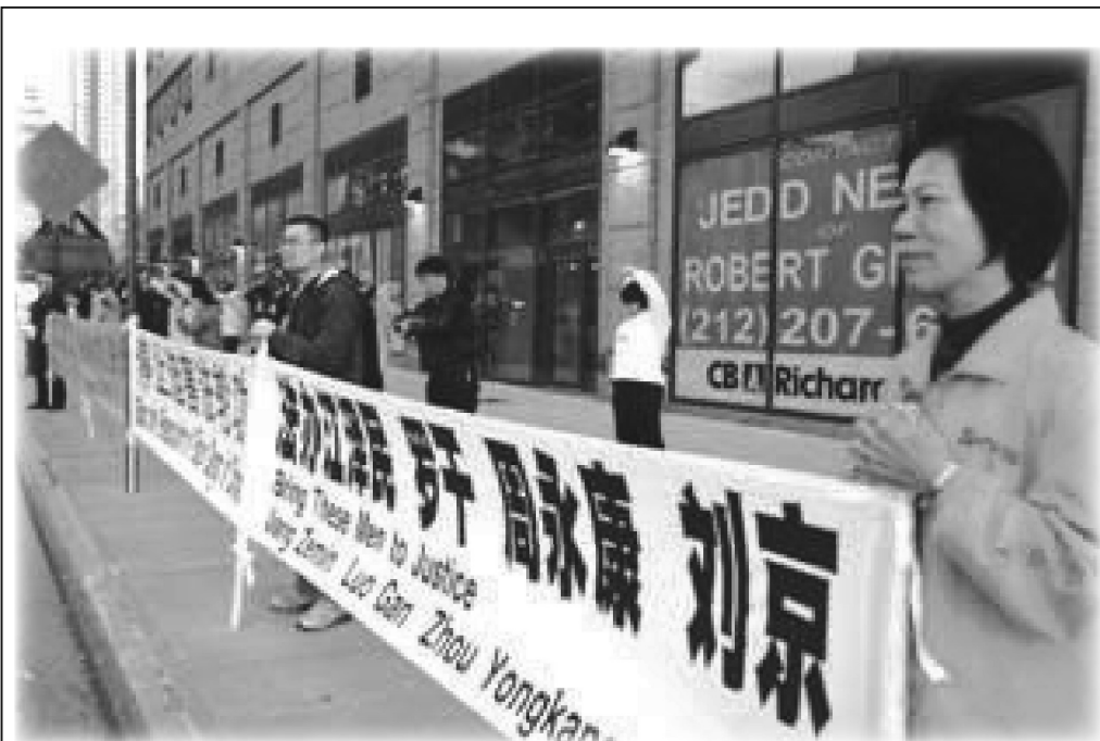
圖：在紐約中領館前，和平抗議中共迫害。