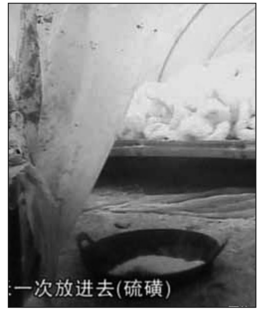
圖：無神論造成的道德崩潰——「民以何食為天」：用硫磺把白木耳熏得更白，毒人不怕，好賣即可。