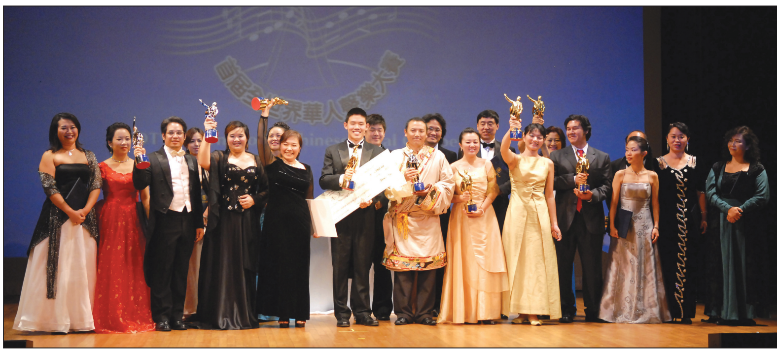
圖：首屆全世界華人聲樂大賽10月17日下午決賽結果揭曉，獲獎演員登台致謝。

Linares)代表市長彭博給主辦單位帶來賀信，他同時代表紐約三百萬在美國以外出生的人，向歌手祝賀，並說在座各位都是贏家。