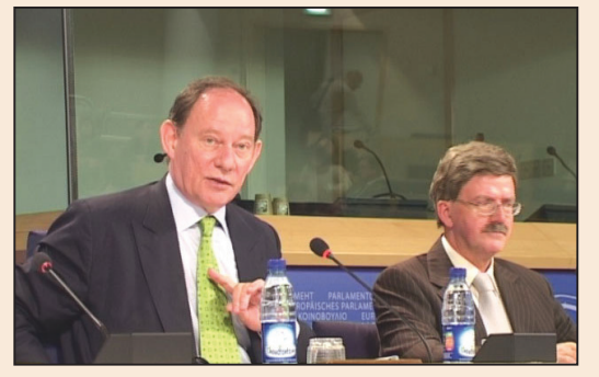
歐洲議會聚集中共對法輪功的迫害(第七版)