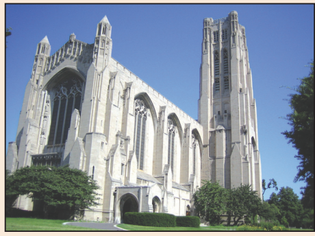
「科學無神論」的尷尬(第三版)