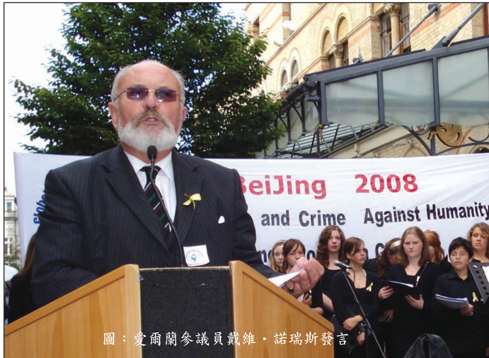
圖：愛爾蘭參議員戴維·諾瑞斯發言

人權聖火的全球傳遞，旨在呼籲國際社會關注發生在中國的人權迫害，特別是中共對法輪功的群體滅絕迫害。參議員喬·奧圖爾在發言中說：「這(迫害)比第二次世界大戰時的納粹集中營還糟糕，他們(中共)最惡劣的行徑之一是活摘器官。這就是中共針對法輪功在世界範圍內的群體滅絕，這必須被制止。」