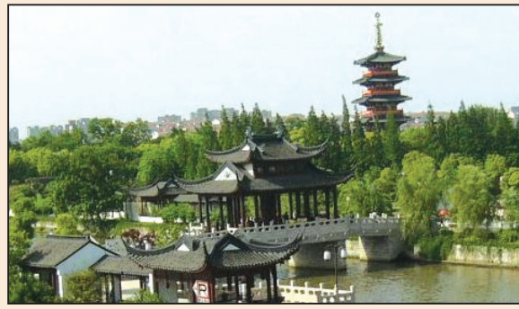
寒山寺千古傳頌之謎(第五版)