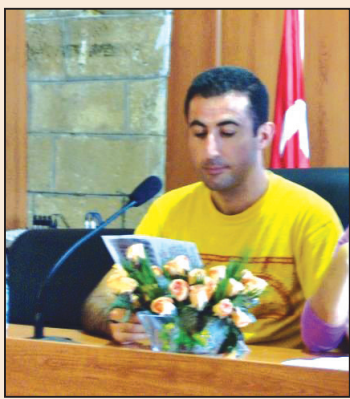
大法讓我獲新生(第四版)