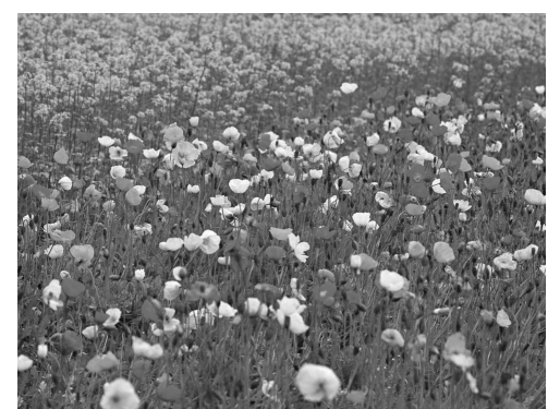
圖：「花籃的花兒香」，原來是罌粟花「香」。

當時負責邊區政府事務的謝覺哉，則以自己的日記提供了佐證。謝覺哉在日記中把鴉片一律稱為「特貨」，說「就是特貨一項得的法幣占政府收入……儘夠支用。」1944年4月9日又記，「據調查邊區內存的法幣不下二萬萬元，無疑是由特貨補足普通物品入超而有餘來的」。可見，經營「特貨」的收入，不僅足夠使用，減去開支，還有不下兩億元順差。「特貨」作為邊區政府的大宗收入來源，顯然成了中共軍隊在抗戰中賴以生存和發展的重要經濟基礎，販賣鴉片到國統區可以腐蝕國統區抗日軍隊的鬥