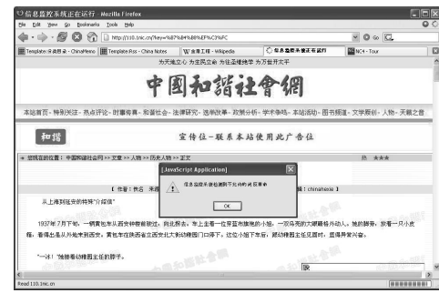
圖：「反革命」成了不允許的詞？