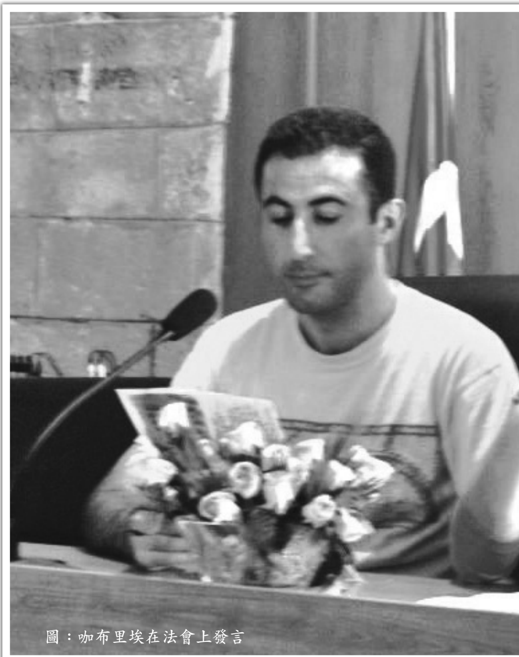
圖：咖布里埃在法會上發言

再後來我想我應該回到我的原籍土耳其把大法也傳播給那裏的人們，於是今年我回到了土耳其。我現在除了研讀功課外就是