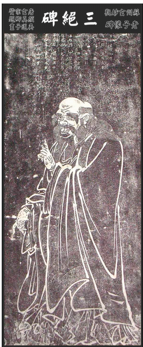
老子曰：「人法地，地法天，天法道，道法自然。」圖為蘇州玄妙觀老子像碑