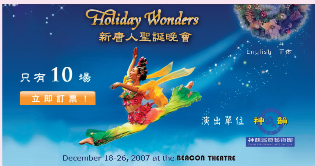
神韻藝術團的精彩演出使人內心受到震撼。圖為2007年神韻聖誕奇觀演出的海報。

人，爲了這一家三代，未婚生子的女孩怎樣在世間生存、做人，她的母親爲女兒憂心、擔心，還要承受世人的羞辱，那個剛剛來世的嬰孩怎樣活下去。和尚沒有考慮自己將要面對的一切，他的善念善行是修行人慈悲的體現，一切都是無私的，爲他的。其中，這個僧人承受了多少，舞劇中世人的指責唾罵表演出來了，還有那沒在舞台上展現的、又必然發生的就留給觀眾很多想像的空間：寺院中的僧人，怎樣撫養一個新生的嬰兒，得吃多少辛苦，有多少付出，討奶水、要飯食，求來尿布、衣物，過程中面對世人的態度，觀眾可以想像的；小孩在成長過程中，生病了、啼哭了、討厭了……，怎麼對待？包括寺院中的其他僧人又會怎樣看？他以一個修煉人的標準嚴格要求自己：面對世人的謾罵指責，視而不見，聽而不聞，無怨無恨，內心平靜如水；面對孩子的頑皮可愛他不喜也不怒，只是對一個生命的慈悲呵護；當孩子父母來認領孩子的時候，他不留戀，能割捨，來了即來，走