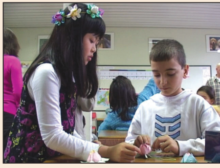
法度的故事 (第七版)