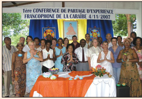
加勒比海地區法會 (第四版)