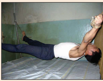
中共監獄殘忍的伸刑 (第六版)