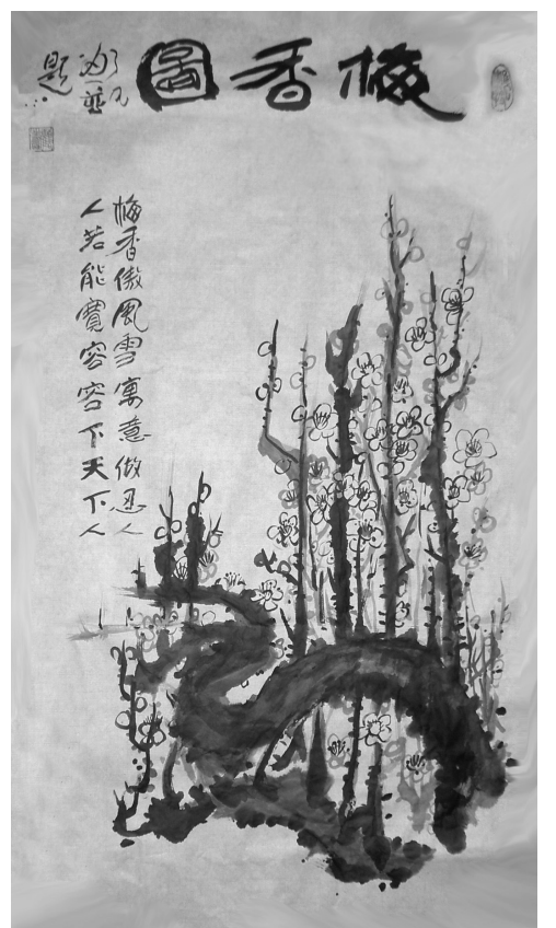
大陸大法弟子繪畫：梅香圖；題詩：梅香傲風雪 寓意傲忍人 人若能寬容 容下天下人

傲然風骨，為世人展現出高風亮節。它們之所以能感動中國人，是因為人們對正人君子高尚品格的推崇，是因為人們心中都期盼著溫暖、光明的春天，期盼著美好、真實和永恆。