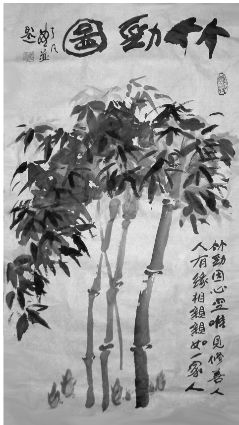
大陸大法弟子繪畫：竹勁圖；題詩：竹勁因心空 唯見修善人 人有緣相親 親如一家人

人們把竹人格化，以竹比德，身體力行，提高自己的品德修養。文人們寫道：「千磨萬擊還堅勁，任爾東西南北風」，「未出土時已有節，待到凌雲更虛心」。把竹子的清雅比為君子的文明有禮，貞潔視為自尊自愛，心空表現為寬容、虛懷若谷等，這些都是古代君子具備的基本品質。