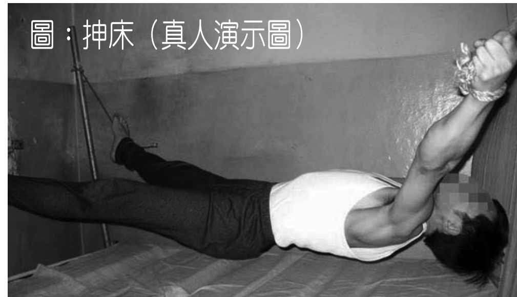
圖：抻床（真人演示圖）

這種令人髮指的酷刑同樣被吉林省女子監獄用來迫害女法輪功學員。在吉林省女子監獄，抻床是將人的四肢固定在床的四角，然後抽走床板，只讓腰部支撐在中間一根半寸粗的鐵管上，其餘身體部位懸空，再把重物壓在腿上，疼痛至極，全身關節象被割開似的，每天24小時這樣綁著，大小便無人問津，直到所謂的「轉化」。被「抻」者求生不能，求死不得，被「抻刑」迫害過的學員之多，程度之嚴重遠不