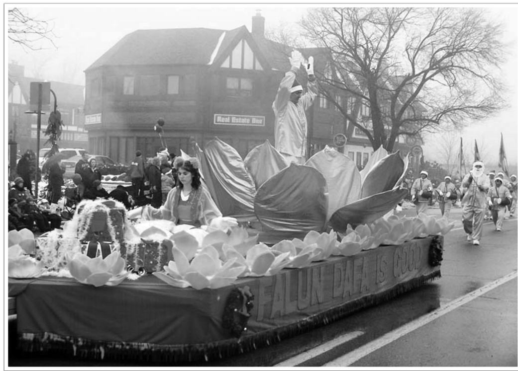
圖：法輪功學員的花車