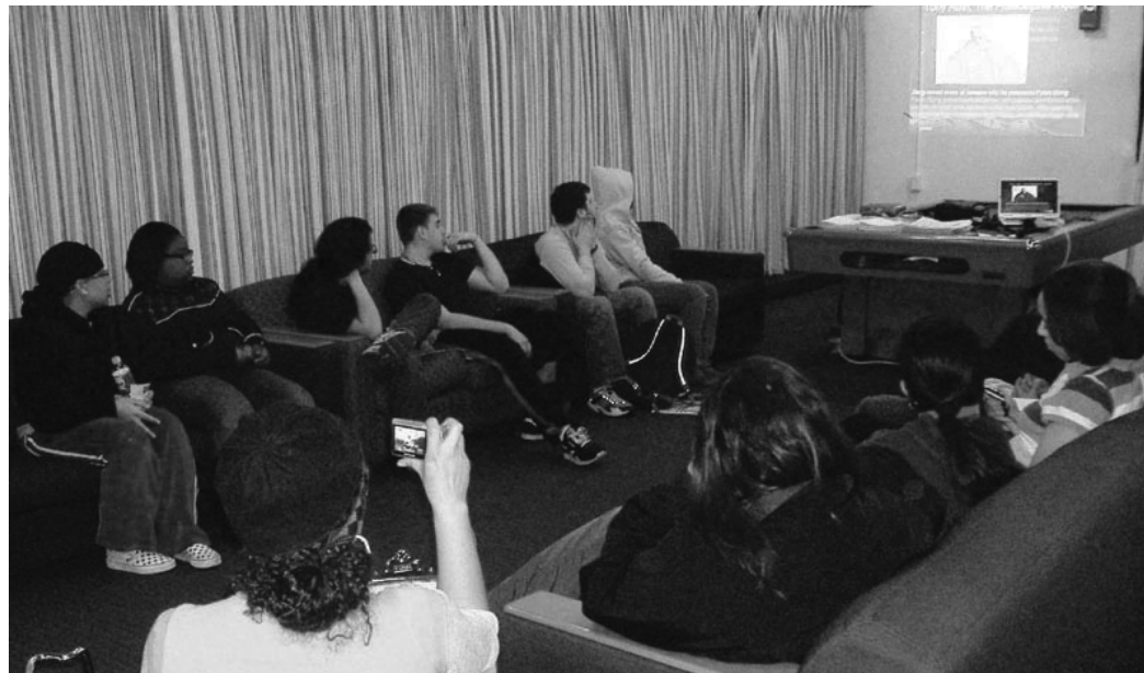
圖：大學生們觀看揭露迫害的投影圖片