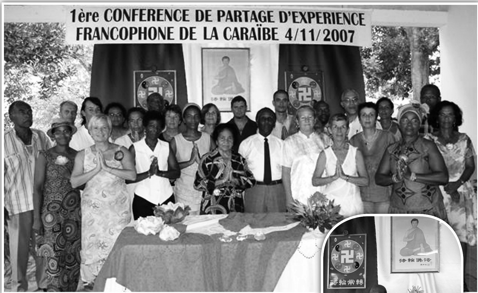
圖：參加法會的學員問師父好 圖：學員們在交流心得