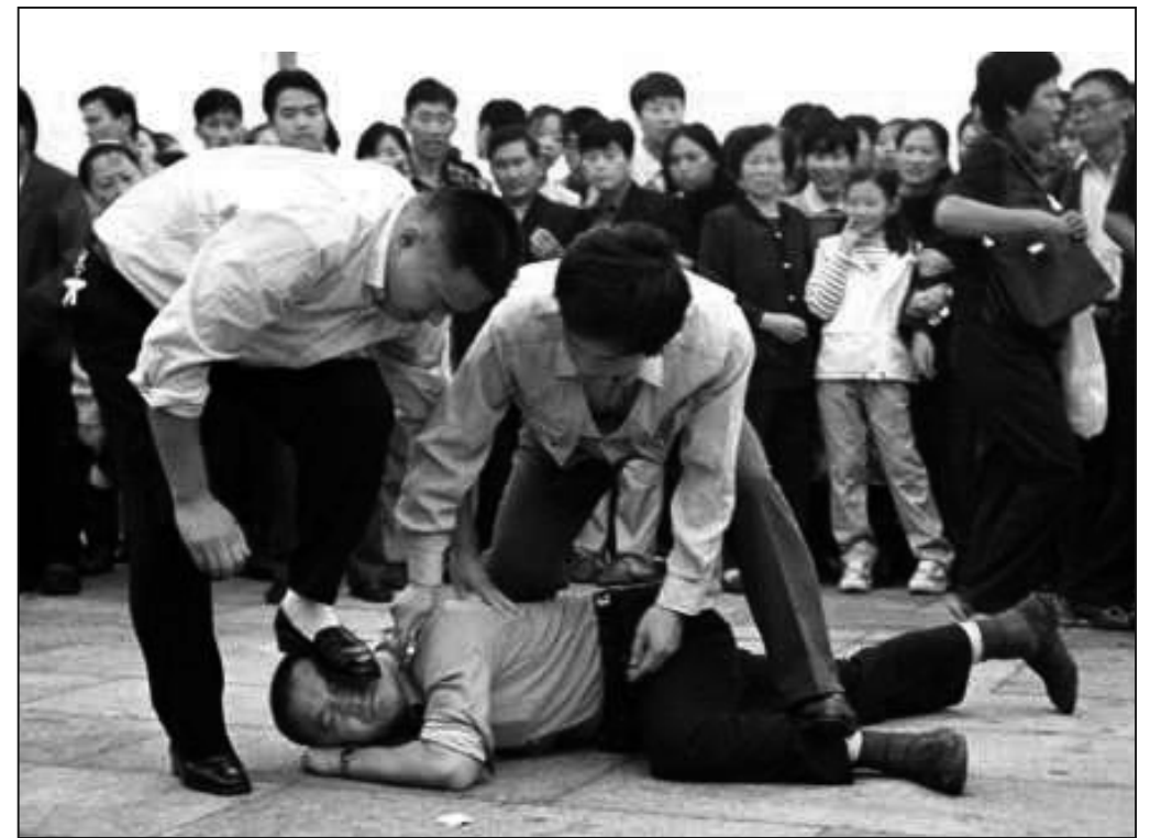
圖：圍觀者觀看中共便衣警察光天化日下毒打法輪功學員。照片由美聯社記者2001年10月攝於天安門廣場。