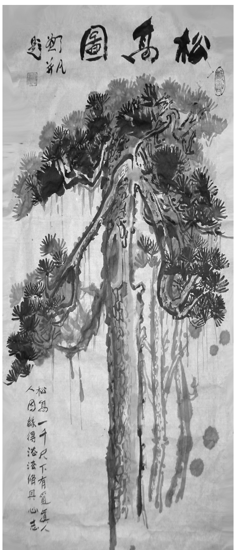
大陸大法弟子繪畫：松高圖；題詩：松高一千尺 下有覓真人 人因緣得法 法修其心志

覺自知歸。」人生短暫，浮生若夢，這也似乎說出了人類最終返本歸真乃是真正解脫之門的道理。（原載《正見網》，明慧週報編輯組改編）