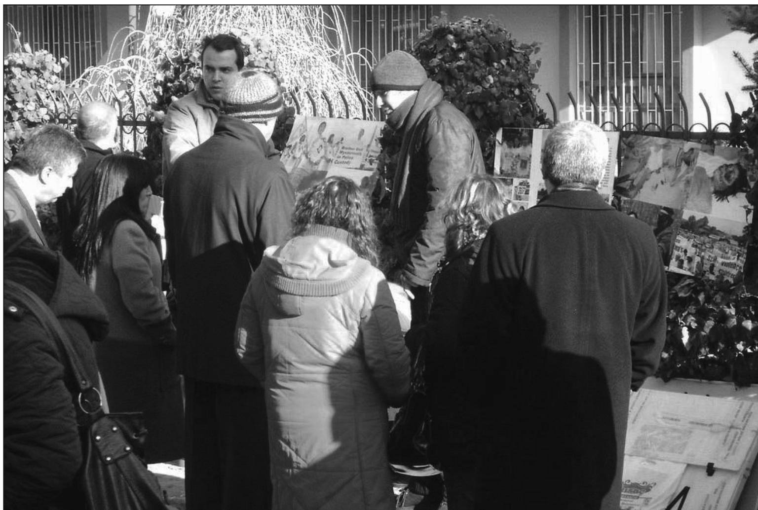
圖：向民眾揭露中共迫害法輪功的罪行

很多法輪功學員夏天連瓶礦泉水都不買，外出常常是自帶「涼白開」。他們說，一瓶礦泉水的錢能做好幾張真相資料。法輪功學員就是這樣各盡所能，省吃儉用，你出一點錢，我出一點錢，從而保證了大法真相資料象泉水一樣源源不斷的流向城市鄉村，流向社會家庭。