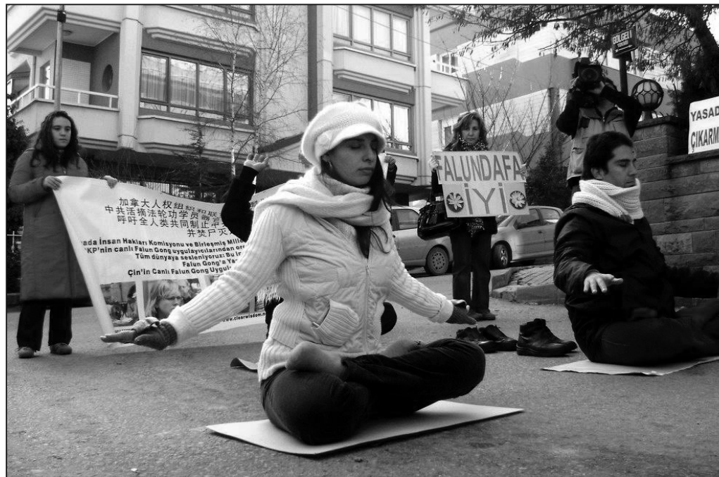
甚至走到煉功學員們的近旁駐足觀看。當地兩家電視台及報社記者到活動現場進行了採訪報導。

祥和的功法、悠揚的煉功音樂，不僅吸引了圍觀的民眾，就連一些中使館的工作人員也躲在陽台上偷偷的觀看學員們煉功。有兩名從中使館出來的中國人，