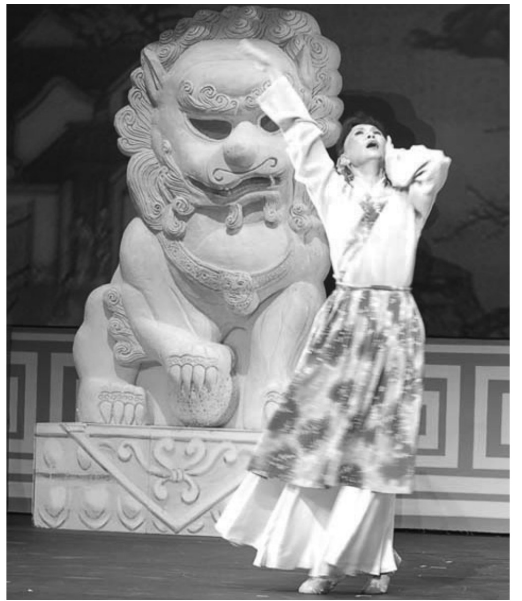
2006年新唐人電視台全球華人新年晚會中的舞劇《紅眼獅子的故事》劇照

在人性與黨性之間，人應該站在哪邊？在生命和利益之間，人應該取捨什麼？在正義與邪惡之間，人應該遵從什麼？在真理和謬誤之間，人應該相信什麼？在盲從和清醒之間，人應該覺悟什麼？在神明和幽靈之間，人應該選擇什麼？