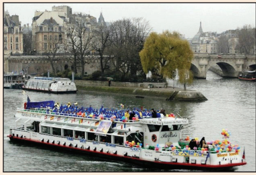
塞納河上天樂起(第四版)