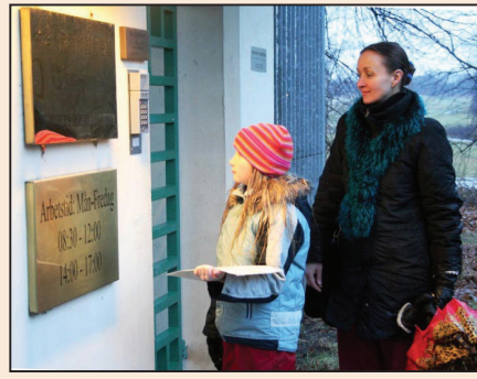
風雨中的堅持(第六版)