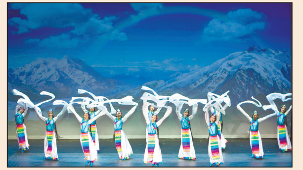
久違的天人合一的和諧美(八版)