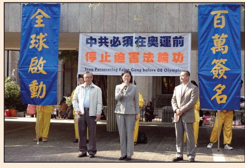
香港啟動百萬征簽反迫害(第七版)