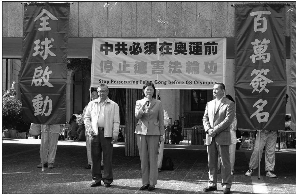
共江氏集團對法輪功群體的滅絕性迫害，令許多善良的百姓流離