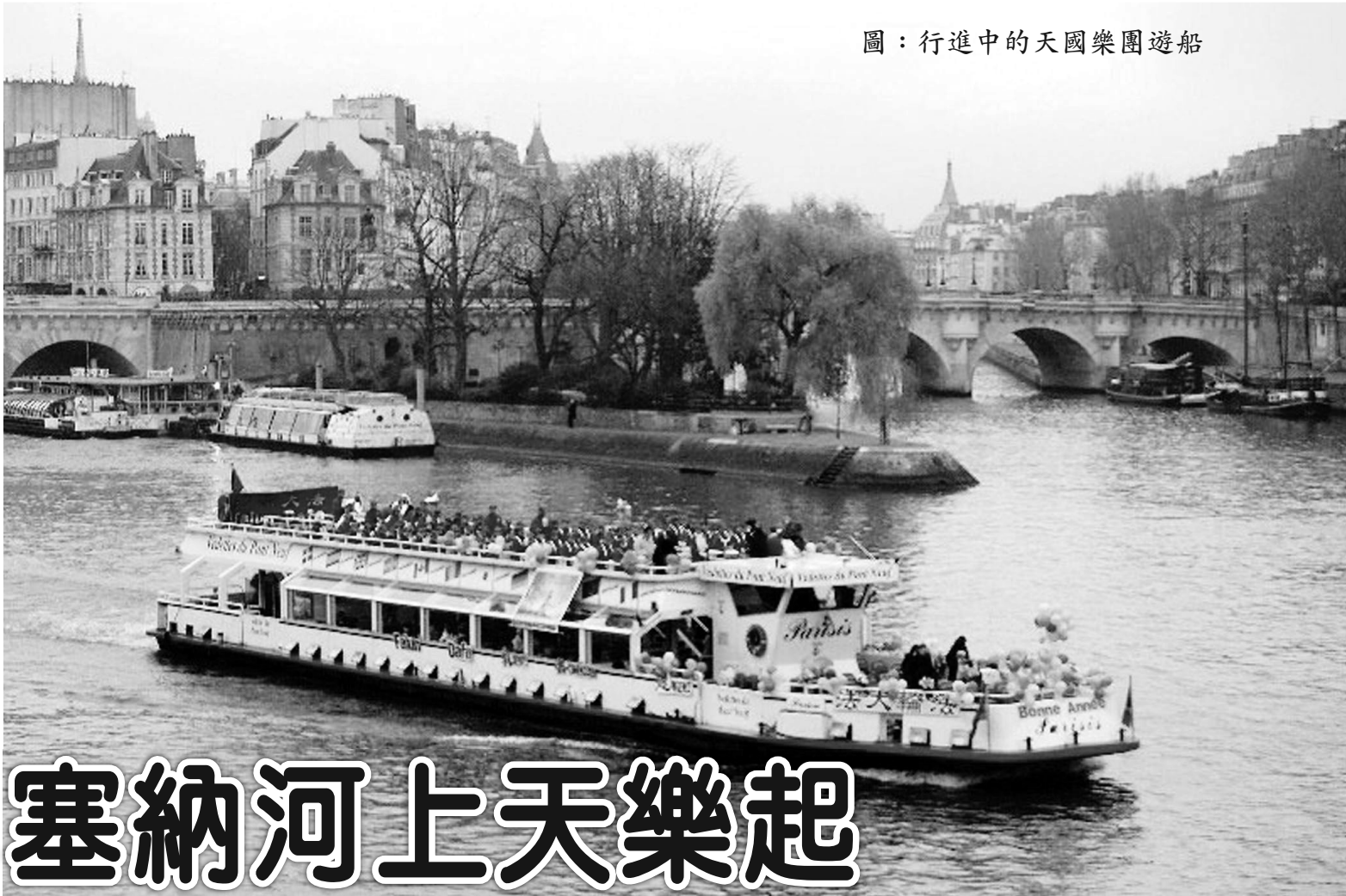
圖：行進中的天國樂團遊船