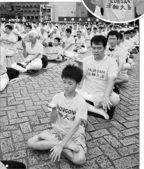
圖：小弟子煉功身影

比如說：某人人緣特別好、功課也頂呱呱，尤其很受到師長的喜愛，這時我會妒嫉的想：他只是外表長的好看，才有好人緣！成績好也只不過是他考試時運氣較好，有讀的部份剛好考出來而已，並不是他的真本事！也說不定是偷看來的！……然後越想越認為自己的想法對，就越覺的自己為什麼不長的好看一些？自己的考試為什麼運氣那麼差？……越想就越氣那個人，越想越覺的自己很無辜，甚至想傷害那