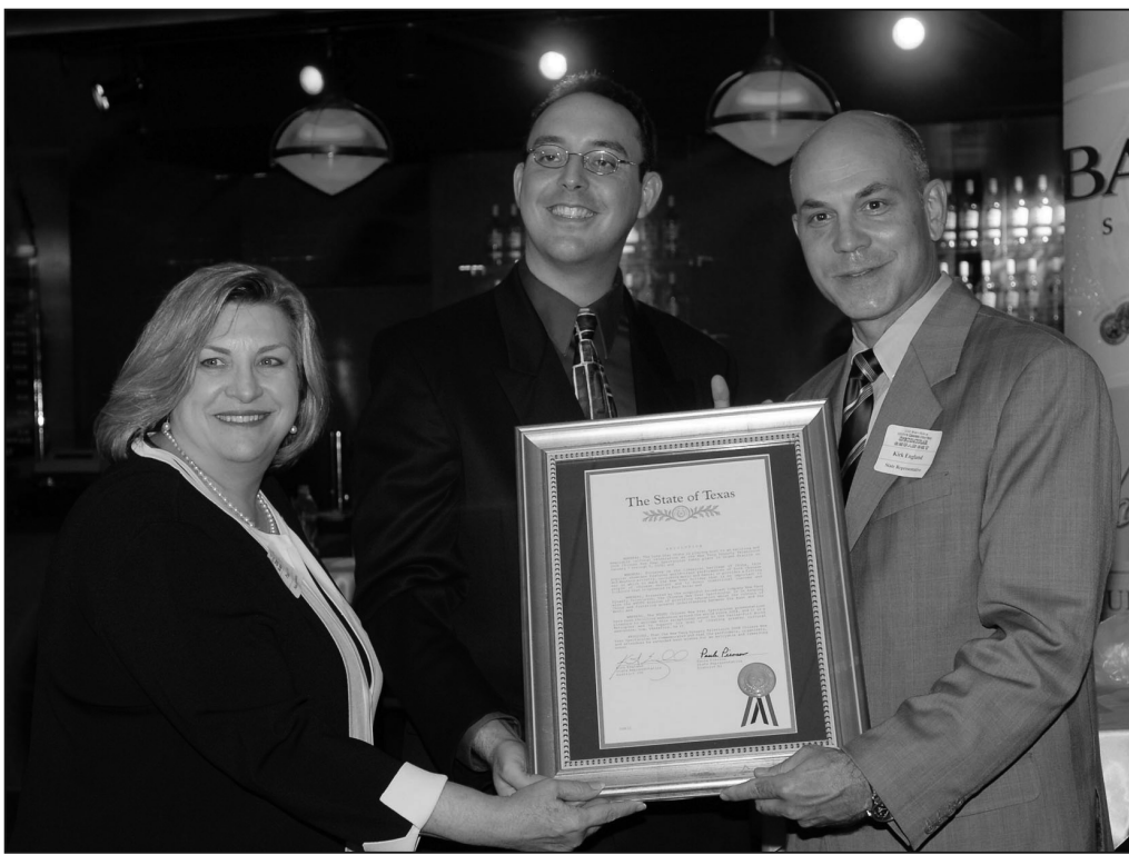
圖：德州州議員Paula Pierson和Kirk England親臨現場頒發褒獎。

【明慧週報訊】二零零八年一月七日晚，新唐人全球華人新年晚會在德州達拉斯首演前，近百名東西方本地要政、商界人士出席貴賓招待會，德州州議員Paula Pierson和Kirk England親臨現場頒發褒獎，向所有的演員、組織者、參加者表示歡迎，並表示能來這裡觀看這個演出感到非常榮幸。