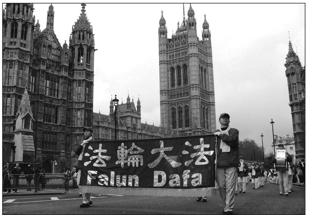
圖：法輪功學員隊伍經過英國議會大廈

文媒體報紙等都給予了關注和報導。CBS電視台Daily Buzz 節目一月二日專訪介紹了中國新年、華人新年晚會的內涵、中西合璧的神韻藝術團樂隊、三維動態立體天幕，以及中國傳統文化蘊含的真誠、忠誠、善良、正義等美德。