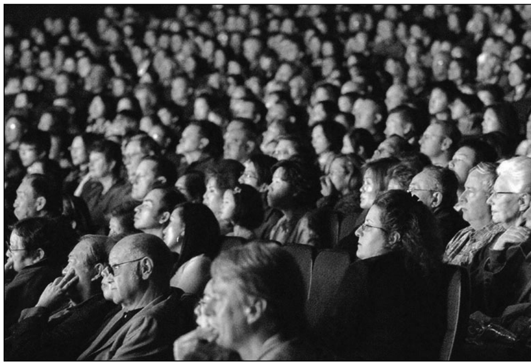
圖：專注觀看神韻演出的洛杉磯觀眾

我並不驚訝於她的回答，因為我也同樣最受感動到於演出中所展現的法輪功女學員被迫害的節目，我的兩位女朋友的先生看這個節目都哭了。三個女法輪功學員被迫害的節目中凝聚了她們的全部心、血和淚。《覺醒》中，溫和善良的真善忍修煉者，在向人們講述法輪功真相時，遭到惡警毒打。面對邪惡的殘暴，世人不再沉默，覺醒的世人站出