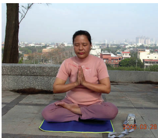
法輪功學員打坐結束時做雙手合十。

端的。人的左右手掌上三條陰經的諸多同名穴位，這些穴位在各自的經絡線上各司其責，擔負著不同經氣運行的任務。他們宛如地下鐵路不同線上的車站，平時各自運載著目的地不同的旅客；非常情況下，當某一線路上的旅客較多時，調度員可以指揮他們疏散到其它線路上，使各條線路=都不擁擠。合十宛如調度的樞紐。從中醫陰陽理論說，身體左側屬陽，右側屬陰，左右手交貼