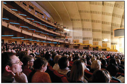
圖：新唐人全球華人新年晚會在紐約「無線電城」上演第六場觀眾

華人新年晚會的首場我來看過，很好。僅隔一天，我又帶兒子來觀看第二次神韻演出。節目《大唐鼓吏》，我看了就激動的流