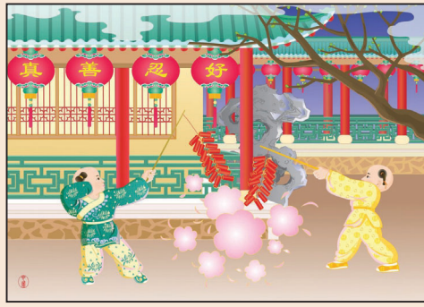
幸福就在轉念的那一瞬間(第三版)