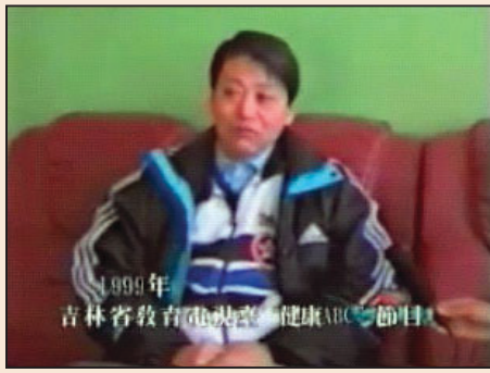
大法使我變了一個人(第四版)