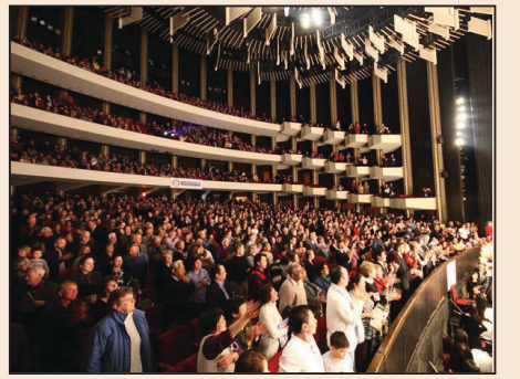
打開人類新思維的神韻演出(第八版)