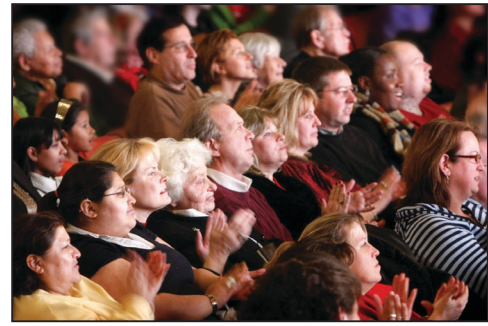
圖：二月四日晚，新唐人全球華人新年晚會第七場部份觀眾