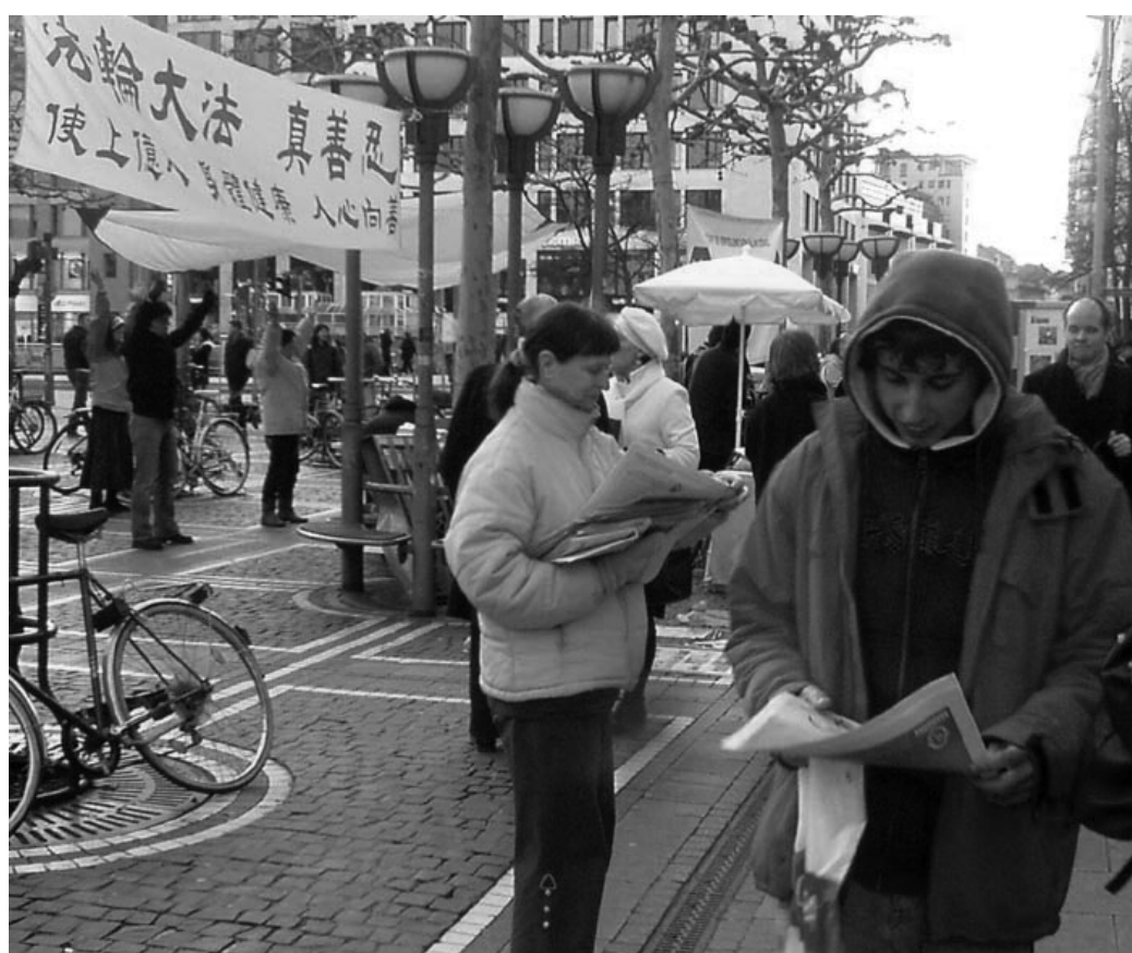
向世人傳達著法輪功的真相