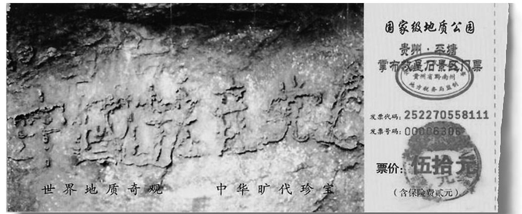
貴州平塘縣掌布鄉的「藏字石」上有天然形成的「中國共產黨亡」六個大字。圖為以此為背景的平塘地質公園「藏字石」景區門票