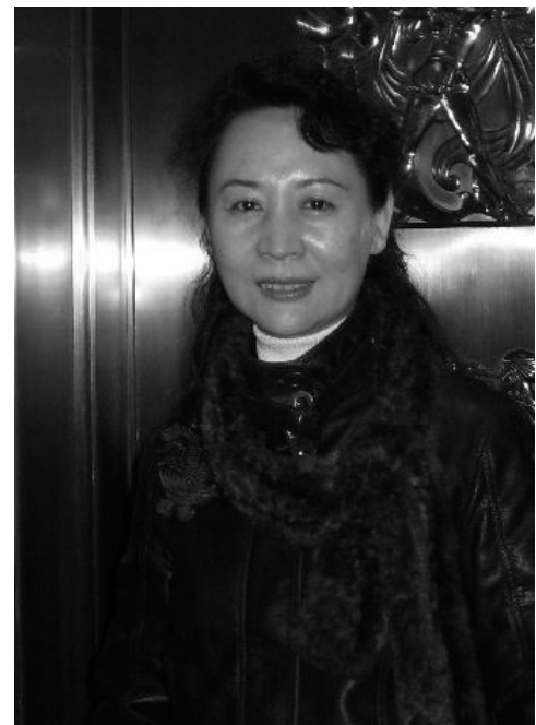
加拿大知名作家盛雪

她說：「面對今天的中國大陸的黑暗現實，要直面中共講真話，堅持自己的良心選擇，雖然有時要放棄或被迫失去許多，我想我們每個人都應承擔起自己的一份社會責任，並且我們每個人的付出都是有意義的。尤其是，這麼多年來，法輪功學員的堅持與付出，一定會有結果，他們最終將使所有的中國人都不再過流亡的日子，都不再需逃避那個黑暗政權的壓制、迫害，不再需逃避那被毒害的環境，不再需逃避人與人之間的爾虞我詐的社會關