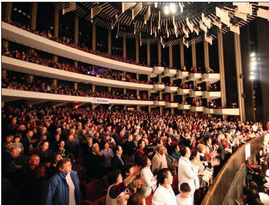
1月14日，神韻巡迴藝術團在渥太華國家藝術中心的演出結束後，現場兩千餘名觀眾起立、揮手，向神韻藝術團致敬

「以超越人類對藝術的追求和努力所能達到的標準推廣文化。」能夠超越人類，是因為神在傳遞