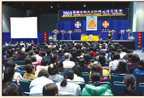
美西法會成功舉行 (第四版)