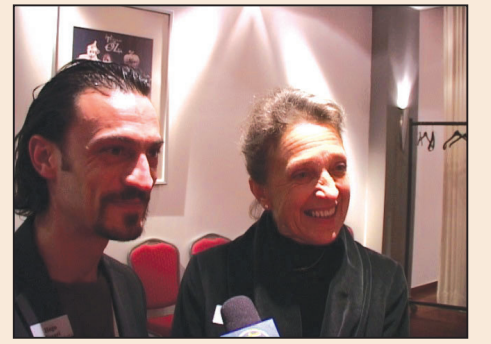
神韻比利時首場爆滿 各界名流盛讚 (第七版)