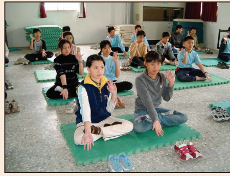
沉浸大法中 身心自在多(第四版)