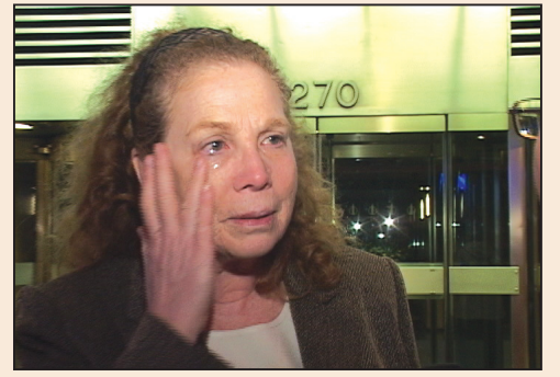
神韻演出所展現的終極關懷和普世價值(第八版)