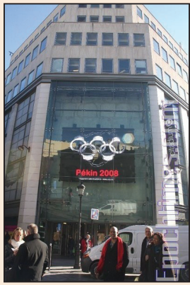
中共「手銬奧運」在民航的表現(第三版)