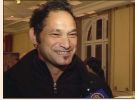
瑞典各界對神韻演出讚不絕口 (第七版)