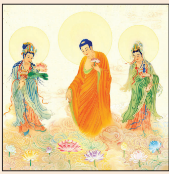
大法破迷 走出生死 (第四版)