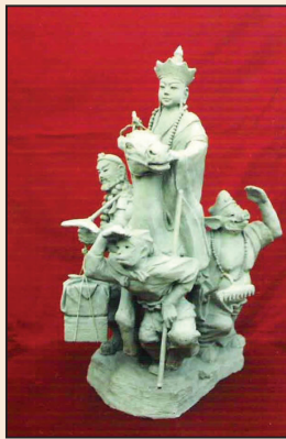
河北民間藝術家再遭綁架 (第八版)