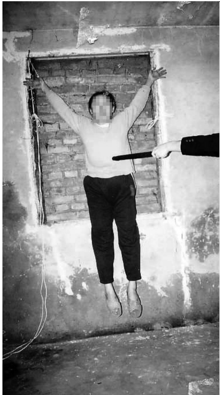
萬家勞教所酷刑圖示：人被吊起大拇指承受著全身的重量，致使手指傷殘。

另外，前幾日，定興縣公安局惡警對在其黑名單上的法輪功學員挨個騷擾。12、3號左右，定興縣有兩名法輪功學員被綁架。