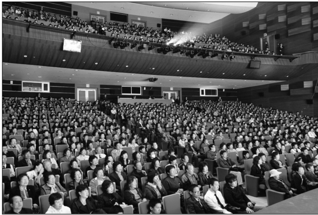
圖：神韻大邱場場場爆滿，圖為第五場再爆滿現場實況。

更離譜的是韓國釜山的演出：六千多張票銷售一空、人們翹首以待享有盛譽的神韻演出的時候，劇場卻因為屈服於中共的壓力，突然違約取消了當天的演出。中共這種執意迫害法輪功而不惜觸犯眾怒的黑社會行為，除了讓韓國民眾同情法輪功學員、認清中共的邪惡以外，還能有什麼呢？更何況，神韻藝術團為了