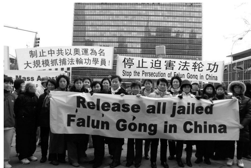
紐約法輪功學員聯合國前譴責中共暴行

星期二中午抗議中共暴行的活動和法輪功學員煉功的祥和場面，吸引了午休時分來往的各國代表及過往行人。法輪功學員還將在本週內向聯合國秘書長及各國代表團遞交公開信和呼籲書，呼籲國際社會關注法輪功學員被中共殘酷迫害的事實，發出強有力的聲音制止中共暴行。