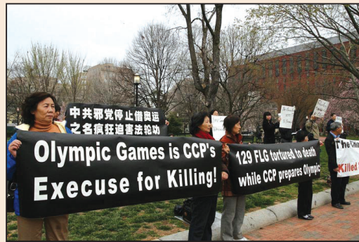
譴責中共借奧運迫害法輪功 (第六版)