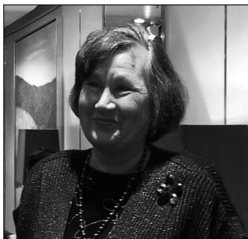
音樂教授尼娜·坡那莫仁科

眼光閃爍著光芒的坡那莫仁科開心的表示：「看到五千年曆史，太令人感動了，令人驚羨的文化，非常有深度，他們表演的文化和藝術，令人難以置信，這個表演真讓我著迷。」