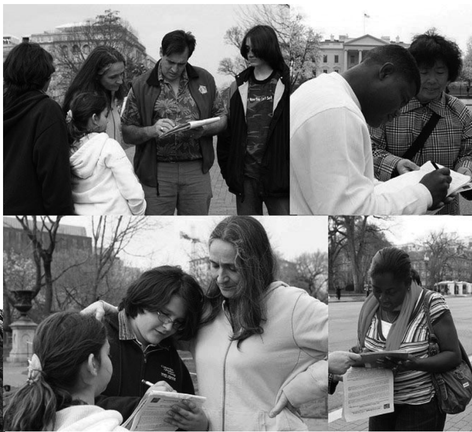
遊客簽名，呼籲制止迫害

（明慧記者李靜菲華盛頓DC報導）2008年3月27日下午，美國首都華盛頓特區部份法輪功學員在白宮前的拉菲葉廣場（Lafayette Square）集會，抗議中共借奧運之名加劇迫害。法輪功學員在集會上講述了最近中國大陸不斷出現法輪功學員被綁架以及被迫害致死的案例，引起很多過往民眾的關注。很多人簽名敦促美國政府制止迫害，還有一些民眾強烈反對踐踏人權的中共舉辦奧運。