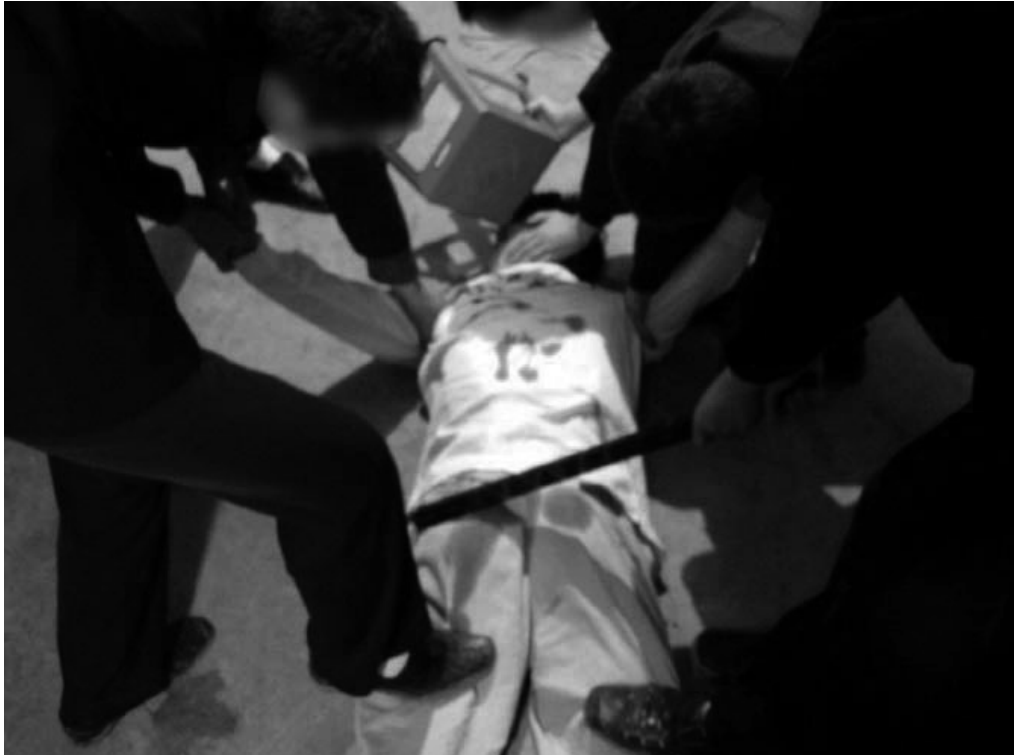
重慶西山坪勞教所惡人毒打大法弟子（真人演示圖）