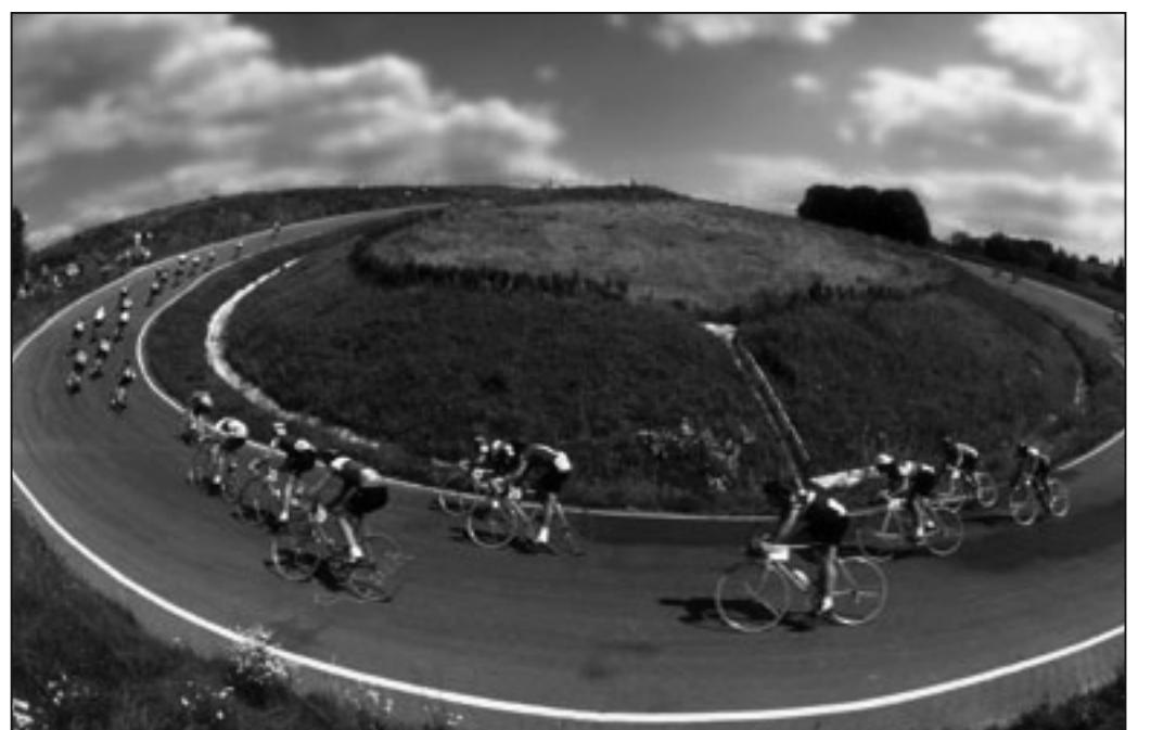
圖：中共抵制了莫斯科1980年夏季奧運會。圖為該屆奧運會自行車比賽場景。

如果說人民期待的是「奧林匹克」，是「公平、寬容、自由」的精神，那中共期待的卻是一場「運動」大會，一場消除異己，杜絕抗議聲音，迫害善良民眾的血腥大會。