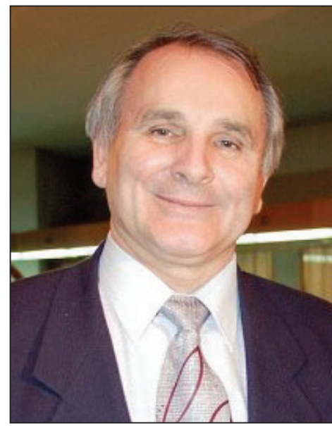
羅馬尼亞國會議員、大學校長派魯斯·安迪亞