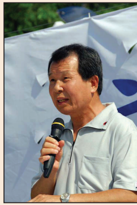
法官的修煉故事 (第四版)