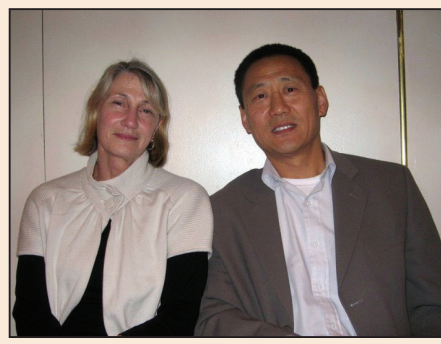
重回中華唐代鼎盛的唯一希望 (第八版)