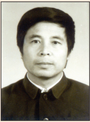
銀匠在保定監獄被 迫害致死 (第一版)