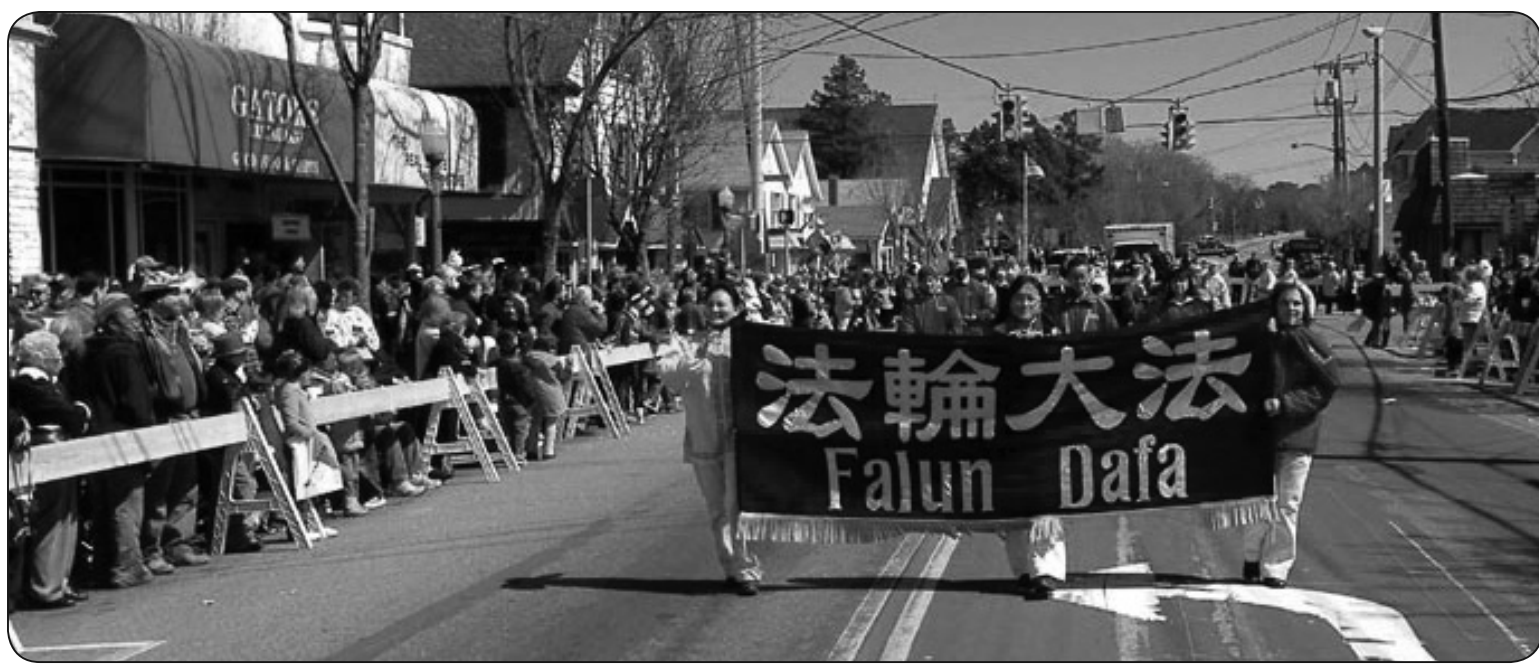
圖：法輪功學員參加紐約長島地區慶祝聖派翠克日的遊行

在沒有學法以前，我對於手上的繁雜案件，總會覺的壓力很大，心情就無法放鬆下來，總想趕快把那案件審結。事實上法官辦案，都是「舊案不去，新案照樣陸續來」，根本不可能把手中案件全部結清。學法後隨著待人處事的態度轉變，放棄急於結案的執著，無論手頭有什麼大案未結，都能以平常心來對待，不因案情繁雜而厭煩，如此思維更密，也較能耐心聽訟，無論當事人的態度再激動，我依然能夠保持心平氣和，反而有助於案情之快速釐清審結，及裁判品質之提升。