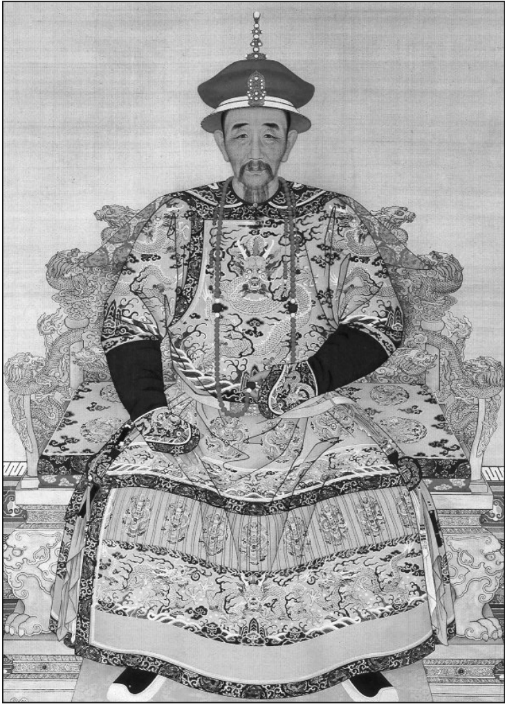
康熙大帝（朗士寧畫）