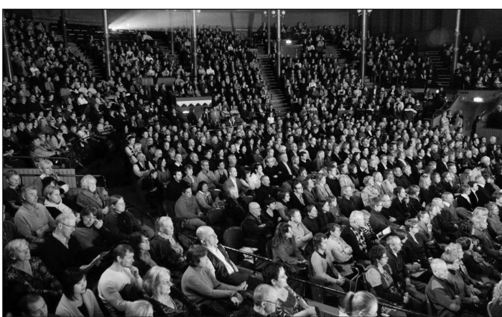
4月3日，神韻巡迴藝術團圓滿完成了在瑞典首都斯德哥爾摩的五場演出。圖為現場觀眾被神韻晚會的精湛演出所吸引。

未來，是神開創的。打開人類的記憶，逾越千年萬年，數世的輪迴，重返最初的家園。在危境中，還有一絲希望，在巨難中，還有網開一面。訴說真相，用歌聲、用樂曲、用舞蹈、用心靈……，指引你回到最初的家園。