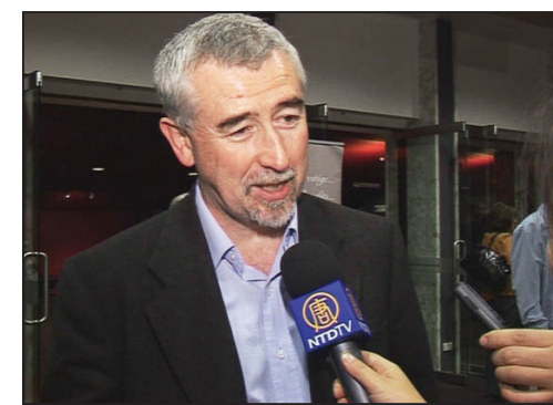
上圖：澳洲聯邦參議員蓋瑞·哈夫雷斯

塔斯馬尼亞島省會Hobart市，他與妻子搭機兩小時，特地到堪培拉觀看神韻演出。他表示：「這場演出在我心中引起了共鳴。晚會的精彩難以用語言描述，從攝影師的角度而言，神韻用創新的高科技所展現的美麗天幕無以倫比。爲看神韻飛到堪培拉非常值