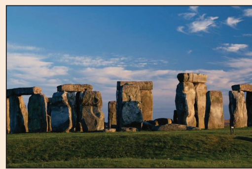
人類史前文化的見證——巨石建築 (第八版)