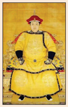
順治皇帝出家的 緣由 (第五版)