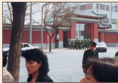
回顧「四·二五」上訪 (第六版)