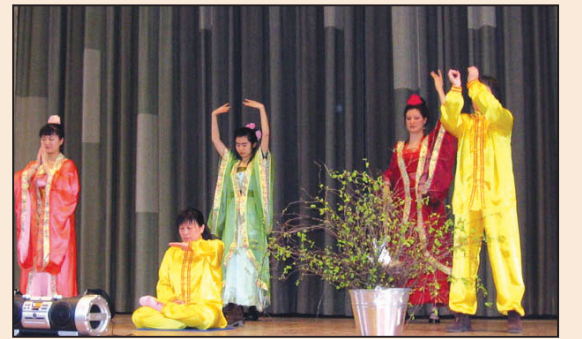
蓮花在芬蘭小城盛開 (第六版)