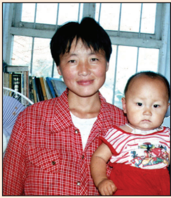
兩姊妹被非法判刑 全家人屢遭迫害 第一版