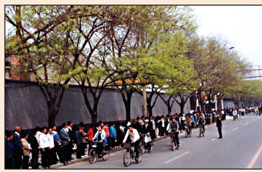
中華民族精神的回歸與超越 (第三版)