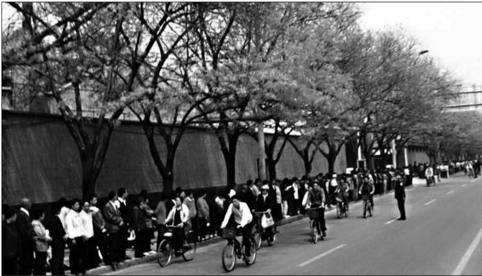
法輪功學員1999年4月5日和平上訪。請注意學員身後的圍牆並不是中南海紫禁城特有的紅色圍牆（可參見頭版圖片導讀中的彩圖）。實際上學員們站在中南海對面的馬路，圍攻之說毫無依據。

從在胡地玄冰中為守臣節而牧羊十九年的蘇武，到安史之亂中以身殉國的睢陽太守張巡；從精忠報國卻在風波亭遇難的岳飛父子，到寫下「人生自古誰無死？留取丹心照汗青」的文天祥；從彈劾閹黨而被捕下獄受盡酷刑的左光斗，到為