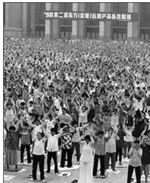
圖：1998年5月沈陽法輪功學員在集體煉功

93年底，到市醫院複查，腫瘤真的無影無蹤了，我從病魔中真的解脫出來了，是大法救了我，給了我新的生命，我真的無法用語言來表達自己對師父的感激之情，我的親朋好友看到了我的變化也非常的感激師父，他們都參加了師父的各地講法班，父母幾十年的老病全都好了，身心健康，家庭和睦，從此家人不再爲我的病擔憂了。十多年了，我一片藥也沒吃，這都是學大法帶來的福分啊！