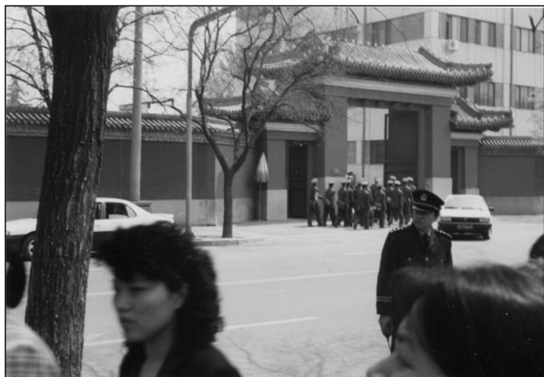
圖：和上訪群眾隔街相望的才是中南海西門。由此可見「圍攻中南海」之說純屬造謠。

四月二十三、二十四兩日，天津市公安局動用防暴警察毆打反映情況的法輪功學員，導致有的法輪功學員流血受傷，四十五人被抓捕。當法輪功學員請求放人時，在天津市政府被告知，公安部介入了這個事件，如果沒有北京的授權，被逮捕的法輪功學員不會得到釋放。天津公安向法