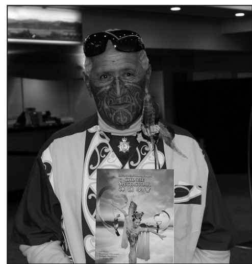
毛利族酋長亞馬托·阿卡若納

從中國大陸來到新西蘭的萬明先生，在觀看演出後感歎的表示，現在在中國大陸很難看到這樣的演出了，他說：「這個我感