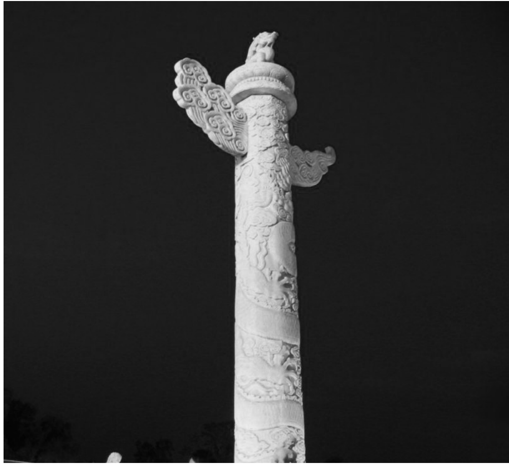
古代的華表是上達民情，起監察作用的

北宋末年，宋欽宗聽信投降派的謠言，把丞相李綱和大將種師道撤職。太學生陳東帶領了幾百名太學生，擁到皇宮的宣德門外，上書請願，要求朝廷恢復李綱、種師道的原職，懲辦李邦彥、白時中等奸臣。東京城的老百姓得知後，也都來到宣德門，聚集了幾萬人。宋欽宗在宮裡派人傳旨說：「李綱用兵失敗，朝廷不得已把他罷職；等金兵