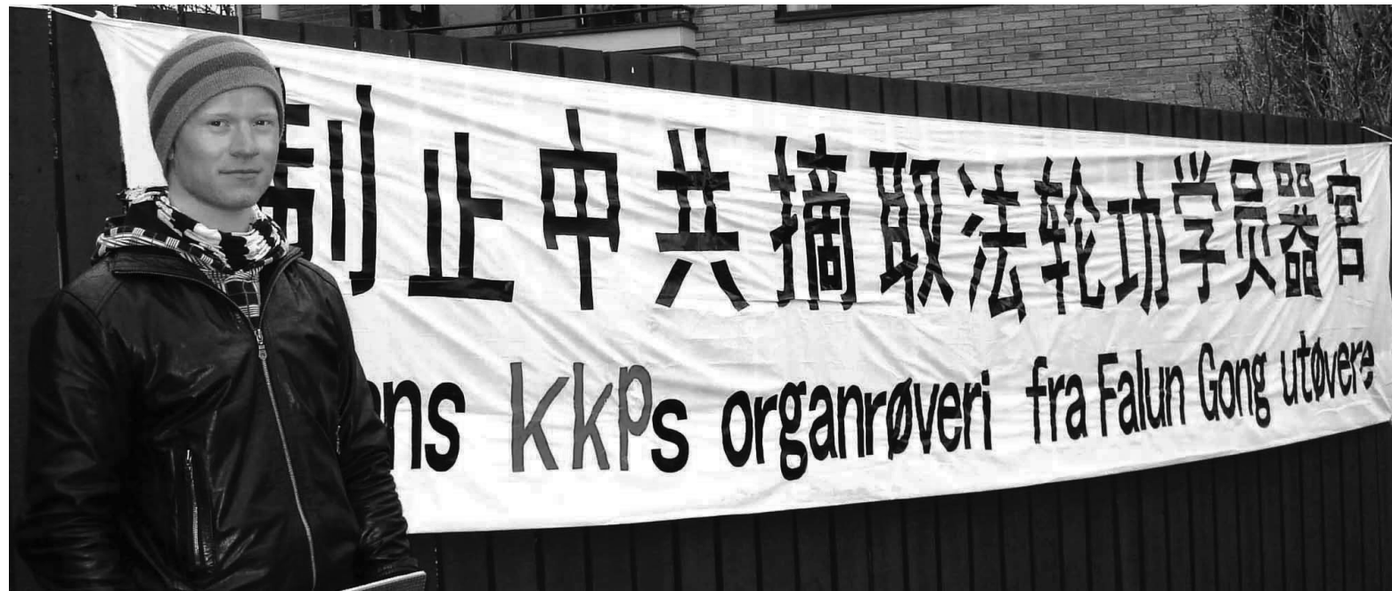
煉法輪大法一個半月後的戊樂