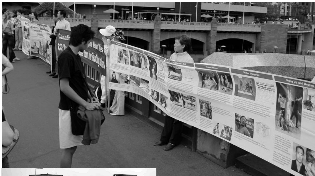
倫敦市中心游行集會

他說：在中共的暴政下，中國人的選舉權、知情權甚至做人的權利都被中共剝奪了，中共才是真正在辱華。