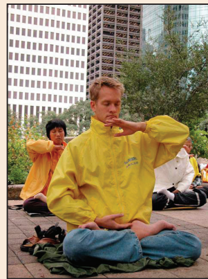
一步步接近真善忍 (第四版)