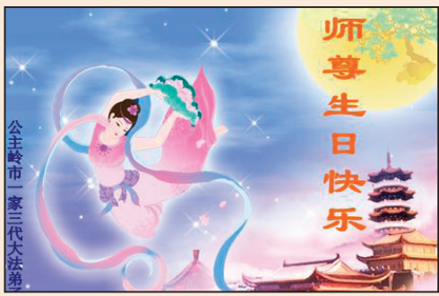
謝師恩—寫在5.13世界法輪大法日之前 (第三版)