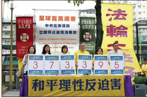
37萬人簽名制止中共迫害 (第六版)