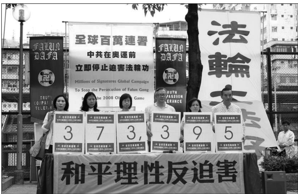
圖：香港法輪功學員在五月一日的反迫害集會上公佈最新聯署數字