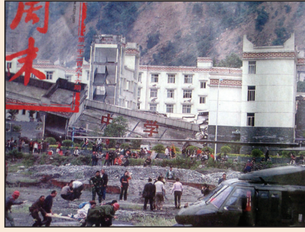
警覺災難中的人禍(第三版)