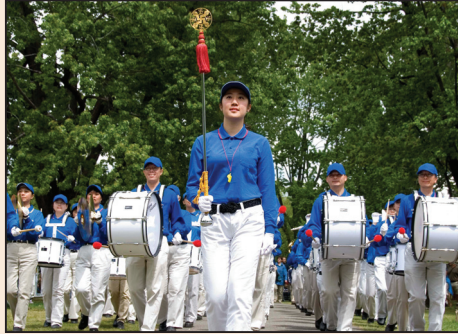
天國樂團重返鬱金香節(第七版)