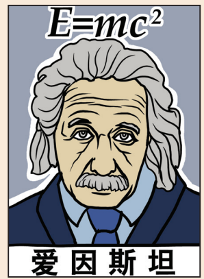
對實證科學的局限性 的思考(第八版)