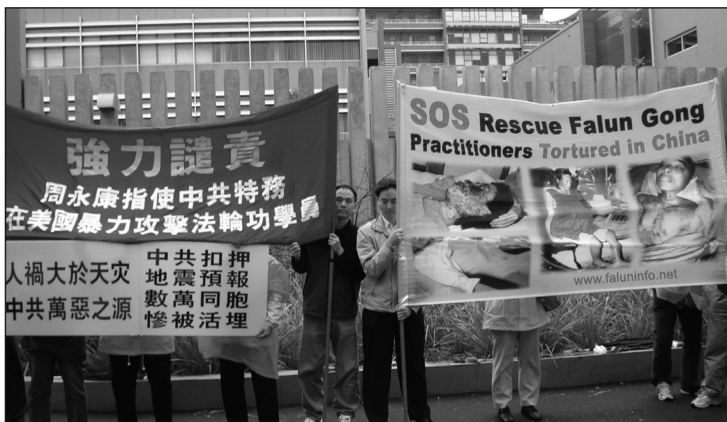
悉尼法輪功學員六月五日中領館前集會抗議中共暴行

員很高興得知紐約的警方對法輪功學員提供了安全保護，以及美國國會議員提出的驅逐中共駐紐約總領事的要求。」他介紹說：「這位警官表示，警方的職責是