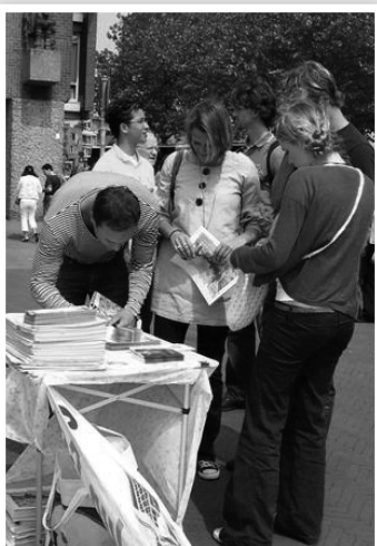
右圖：法輪功學員舉辦抗議中共迫害的活動

由此可見，中共的貪污腐敗是比地震還更可怕的災難，吞噬了多少本可以倖存的生命！無怪乎悲憤的學生家長在孩子遺體旁打出這樣的標語：「我們不怨天災，只恨人禍！」