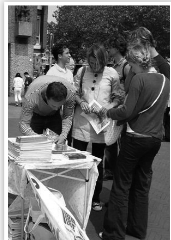
右圖：法輪功學員舉辦抗議中共迫害的活動 左圖：人們在「全球百萬簽名反迫害」請願信上簽名