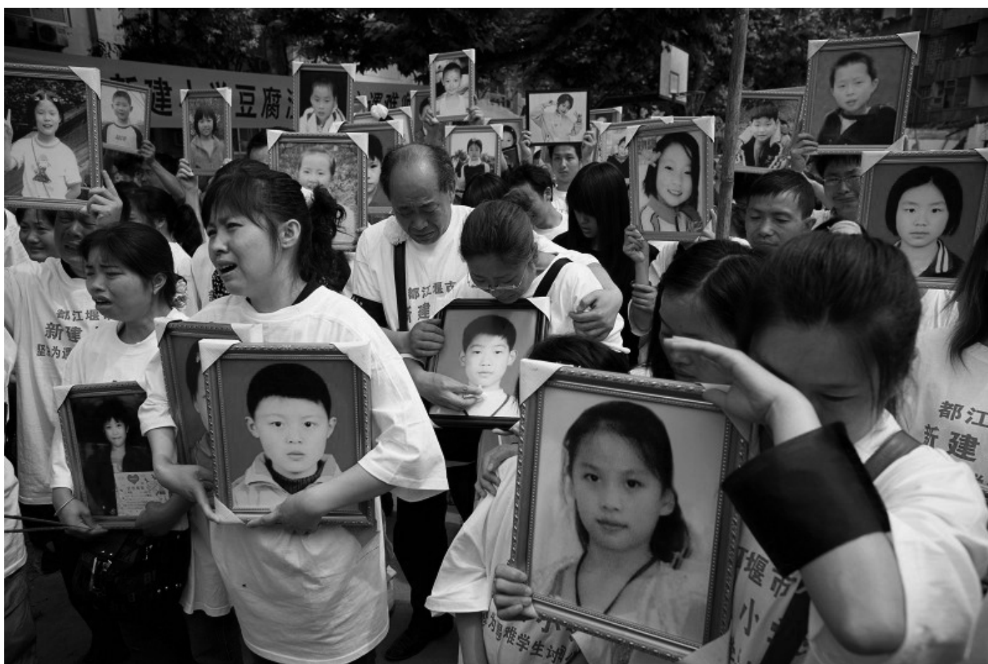
圖：六月一日，四川都江堰88餘名家長神情悲憤的相聚一起，要為地震中死難的親人討還公道，也為死難的孩子們補上最後一個兒童節

許多人在「全球百萬簽名反迫害」請願信上簽了名。「全球百萬簽名反迫害」是由「法輪功受迫害真相聯合調查團」（CIPFG）發起的，旨在要求中共停止迫害法輪功。