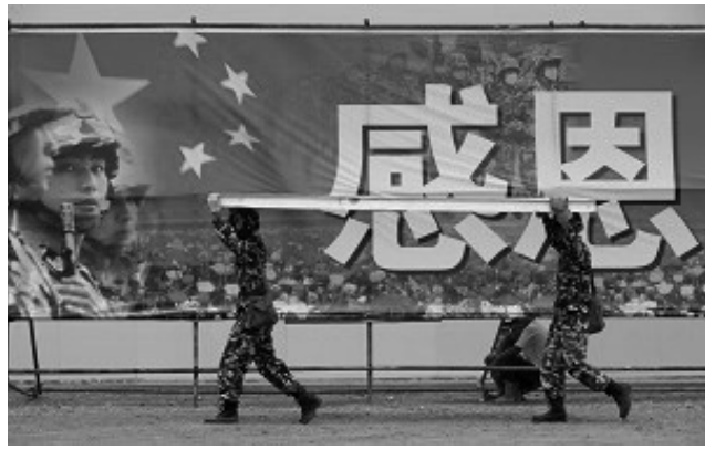
把喪事當作喜事辦，是中共的一貫手段

這些年來，共產主義的信仰破滅了，中國人沒有了信仰，要說有，那就是「發財掙錢」成爲了信仰，這也是中國社會道德日益下滑的根本原因。一場大地震，讓很多人變得無私起來，獻血、捐款、志願者服務……人性