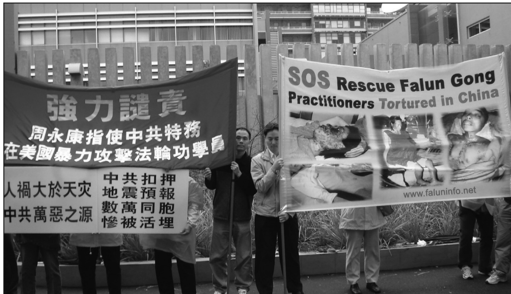
悉尼法輪功學員六月五日中領館前集會抗議中共暴行

員很高興得知紐約的警方對法輪功學員提供了安全保護，以及美國國會議員提出的驅逐中共駐紐約總領事的要求。」他介紹說：「這位警官表示，警方的職責是