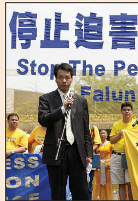
海外華人譴責中共法拉盛暴行 (第七版)