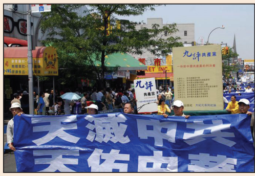
駁紐約唐人街攻擊法輪功的傳單 (第三版)