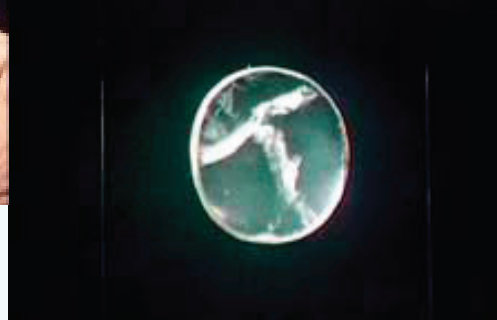
二千年前的古代光學玻璃鏡片放大圖：雖有破損，但仍可見製作之精細（攝於大英博物館）