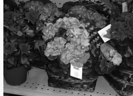
圖：照片為美國超市裡「中國製造」的膠花

但並不是所有的人都能活下來。我就親眼見到一個剛進來不久的犯人在這樣的環境中很快死去——不是被犯人打死的，是被那個環境折磨死的。但正如惡警所言：「你們在這裡死了，還不如一條狗！」床單包裹著就抬出去了。有的犯人自殺，用「花槍」往自己肚子上連扎數刀。處理方法更簡單：抬出去，用一塊「創可貼」粘住傷口，然後把手腳都用鐵鏈子鎖在木頭「十字架」上，就搞定了。另外，看守所裡人頭數最重要，每天要蹲下舉手