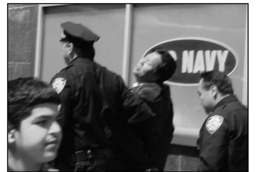
警方抓捕一名涉嫌暴力毆打法輪功學員嫌犯。

4) 在準備入美籍考試時，美國政府和移民局很清楚地告訴和教育將要入籍的無論從哪個國家來的人：國家，憲法和政黨之間的關係。這是作為一個美國公民的基本知識。對比之下，中共卻長期給中國人民灌輸著：共產黨=中國=中華民族。有意地混淆這幾個名詞中的定義和人們的邏輯思維。其居心何在呢？就是要把海內外對中共有不同看法或意見的言論，能輕易地劃歸為：反中共就=反「中國」，再=反