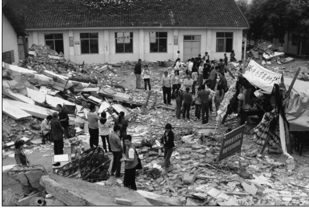
中共制造的豆腐渣工程，害死成千上万花季的孩子

敗絮之三：司法造假。憲法是國家立法和執法的準則，她是高於國家範圍內的一切法律和政黨，也就是說，一個國家，無論是哪個政黨當政，都不得在憲法準則下管治國家。中國也有憲法，法律條文更立了不少，但是，這是保障中共自己一黨專制執