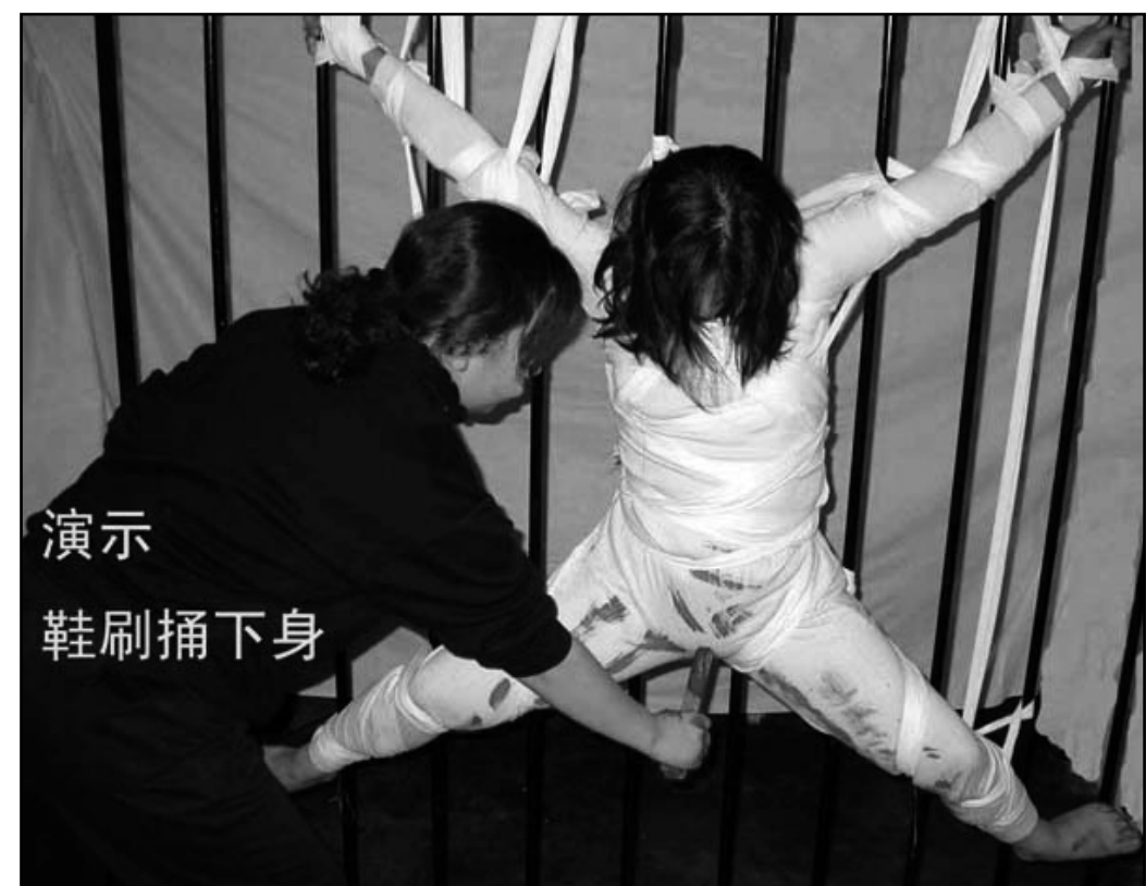
圖：遼寧大連教養院酷刑圖示：鞋刷捅陰部被裸身呈“大”字形吊起，陰部被鞋刷猛捅，致下身血流不止，暈死。

甚至連買菜都有人跟著。3月19日突然下令把他老伴趕出空軍指揮學院，並在家門上打了兩道封條，又加上鎖。