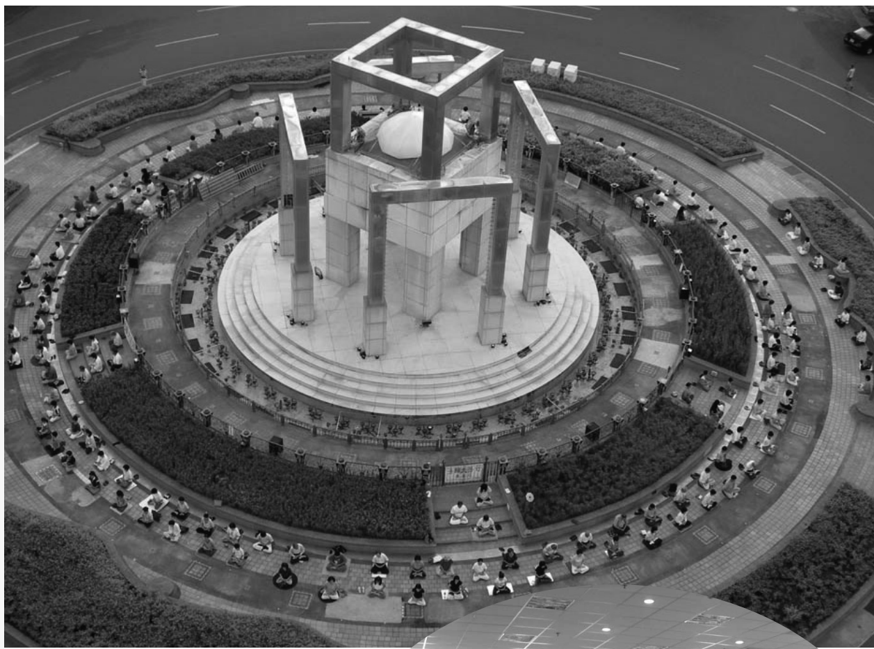
圖：法輪功學員週日在雲林斗六地標斗六圓環晨煉。